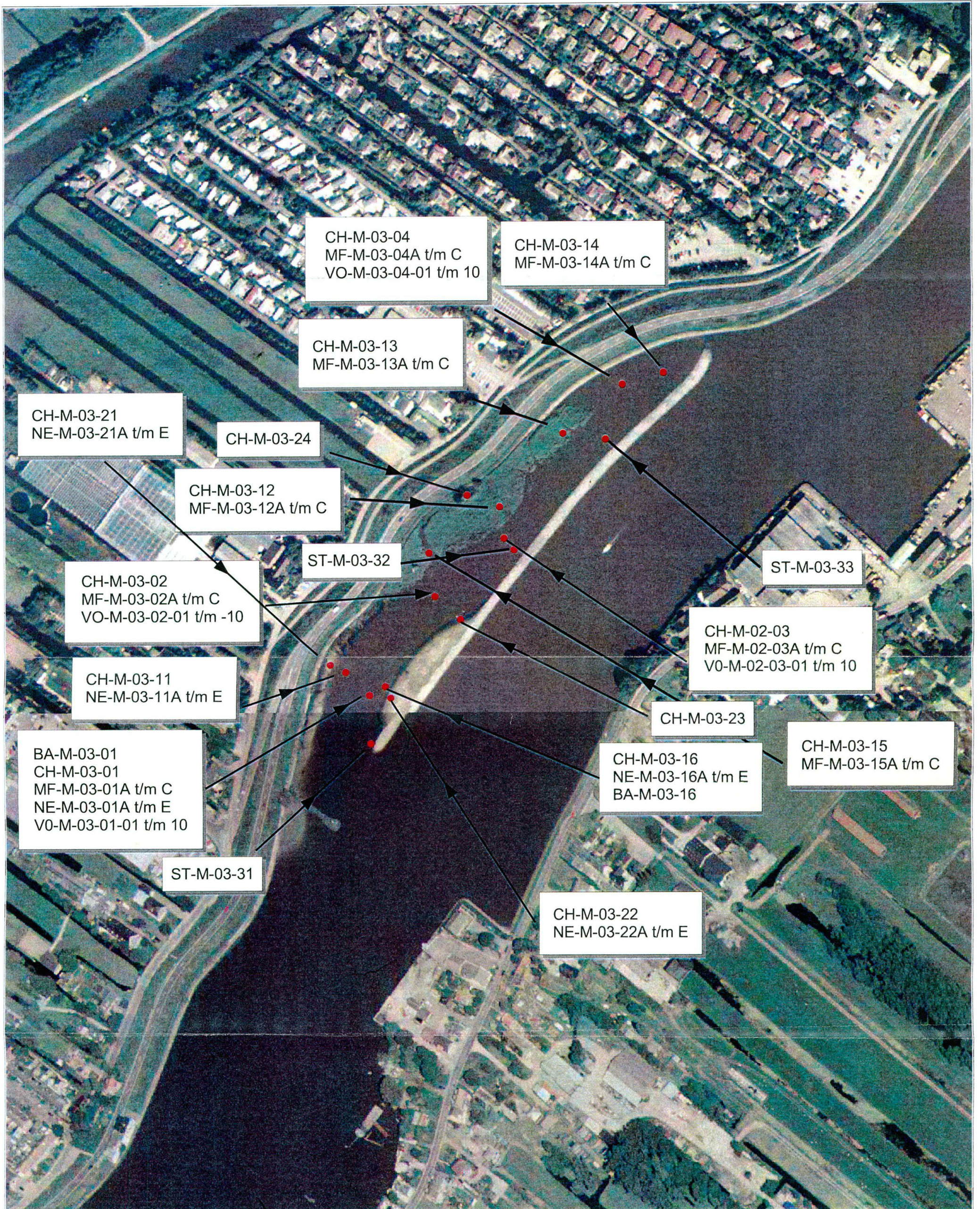
Bijlage 1.1: Bemonsteringsplekken Moordrecht-Oost 2003