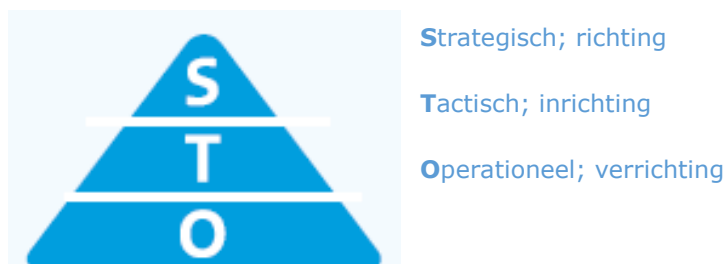
Figuur 1. Strategische, tactische en operationele doelen

De strategische hoofddoelen geven de richting aan van het beleid en zijn uitgewerkt in tactische subdoelen; deze vormen in feite de inrichting van het kuststelsel. Tenslotte zijn er operationele doelen, die aangeven hoe het beleid wordt uitgevoerd ( verrichting, of werkwijze ) (Figuur 1).