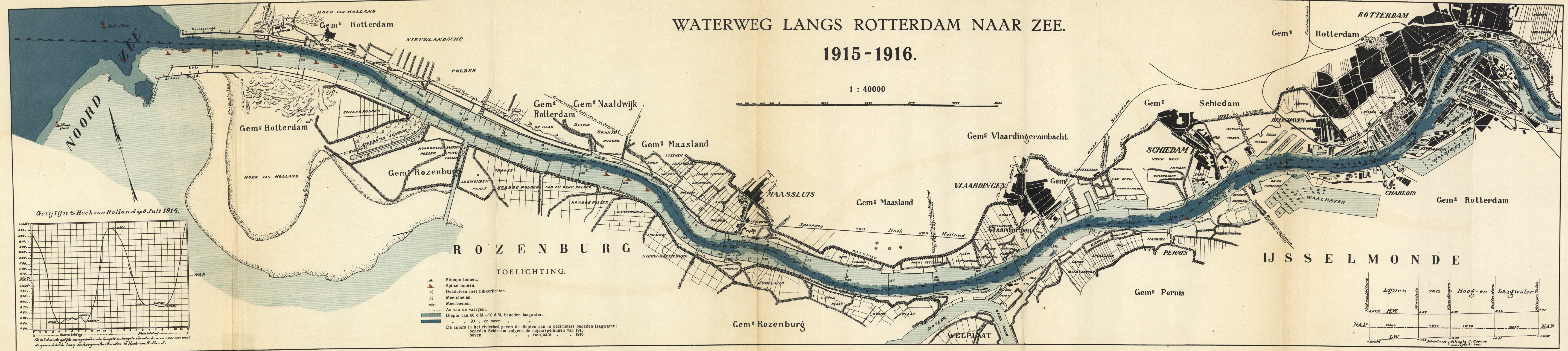
Geltlijn te Hoek van Holland op 6 Juli 1914.