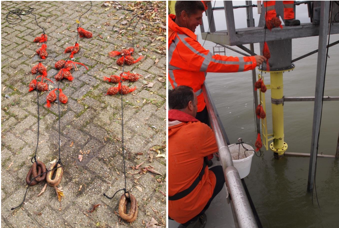
Figuur 2. Voorbeelden van het uithangen van de mosselen. Bevestiging van de mosselen aan het koord (links) met schakels als gewichten, uithangen van een koord aan een meetpaal met een cementanker om het koord strak te houden (rechts).

Per locatie zijn ongeveer 15 netjes met quaggamosselen uitgehangen, wat neerkomt op 4,5 kg bruto mosselen. De netjes met quaggamosselen zijn in week 41 op de diverse locaties uitgehangen. Deze najaarsperiode is bewust gekozen, omdat de paaiperiode (productie en afzetten van ei- en zaadcellen: gametogenese) dan is afgelopen en de overlast (storm, ijsgang) van herfst en winter nog gering is. De netjes zijn in week 47 weer opgehaald. De accumulatieuur in dagen is weergegeven in bijlage 1. Een aantal netjes met mosselen is niet uitgehangen, maar in week 39 in de vriezer opgeslagen om de uitgangssituatie (IJsselmeer-Zeughoek en Spaarne-Haarlem) vast te leggen.