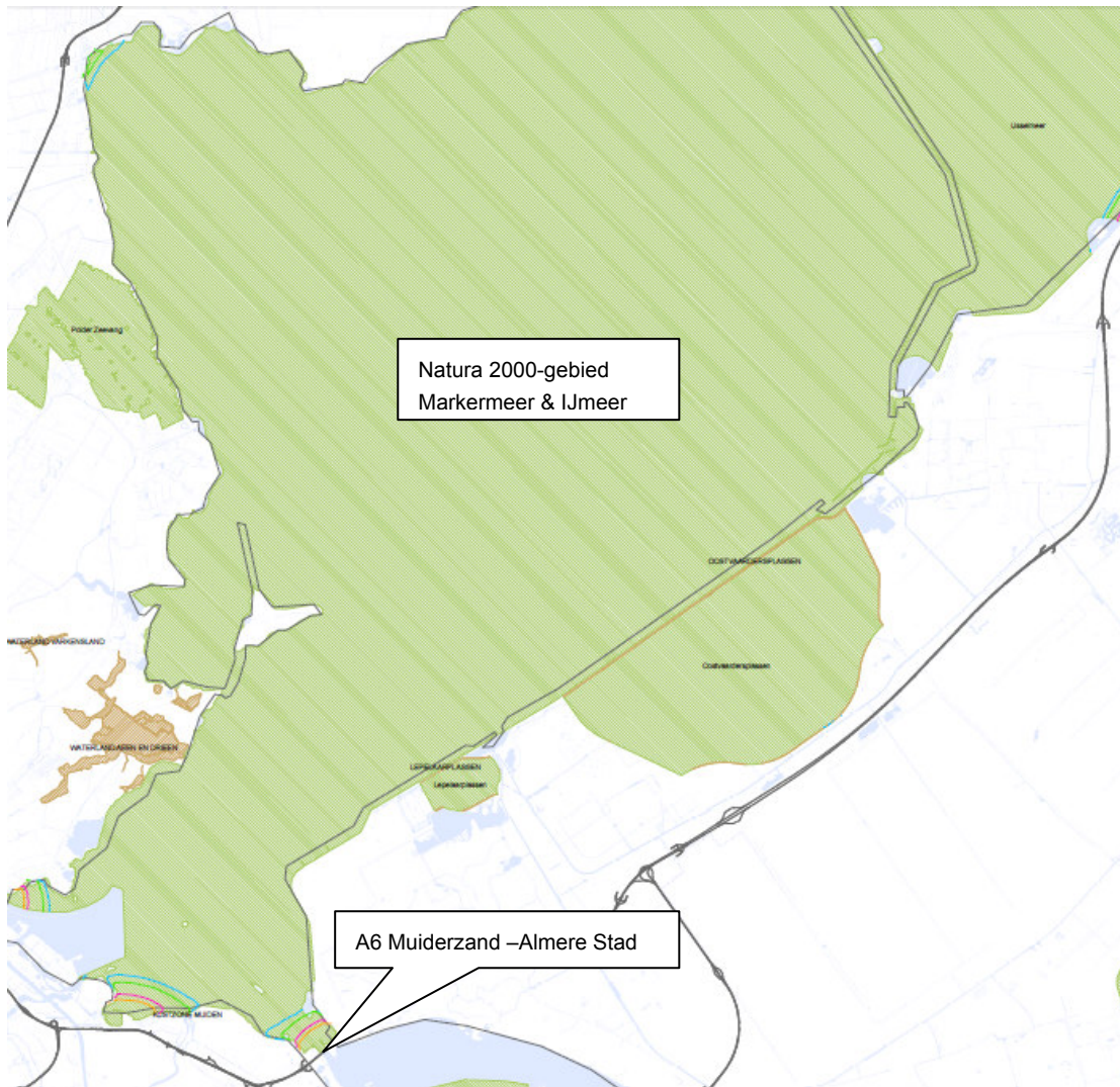
Ligging geluidscontouren A6 t.o.v. Natura 2000-gebied Markermeer & IJmeer.