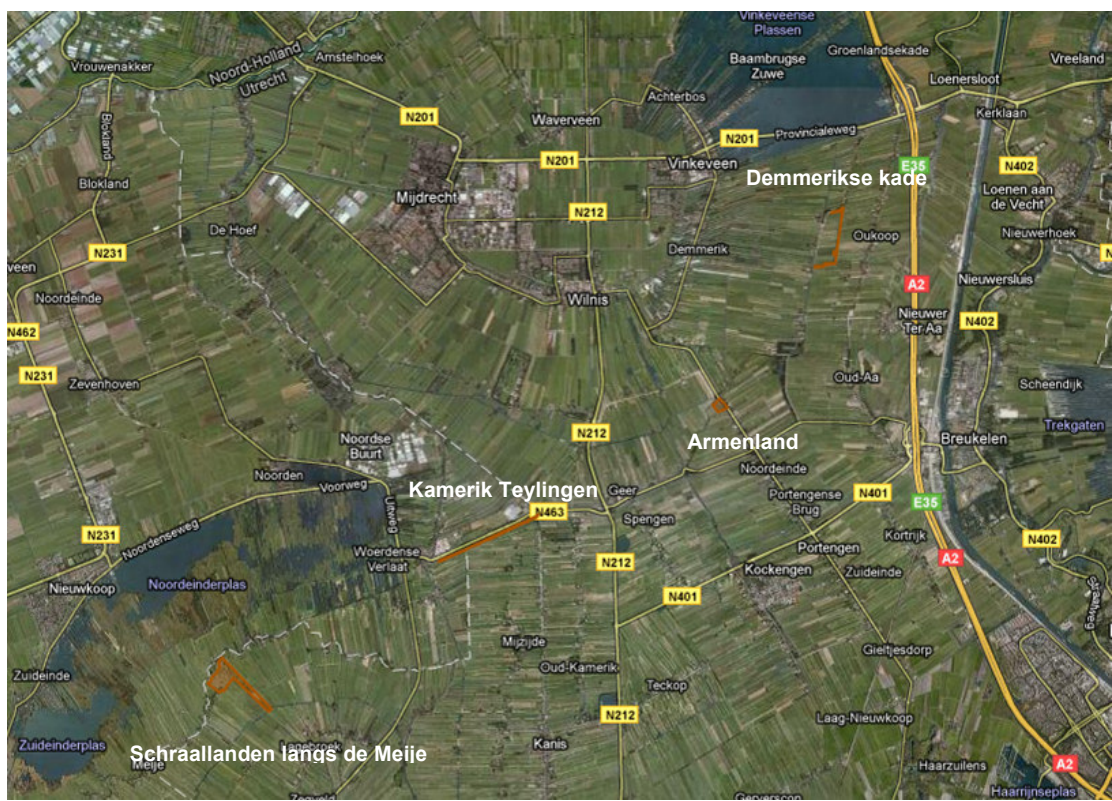
Ligging deelgebieden (oranje) van Schraallanden Utrecht West.

Er is geen beheerplan beschikbaar van het Beschermde Natuurmonument Schraallanden Utrecht West. Voor het Natura 2000-gebied Nieuwkoopse plassen & de Haeck is ook nog geen beheerplan beschikbaar.