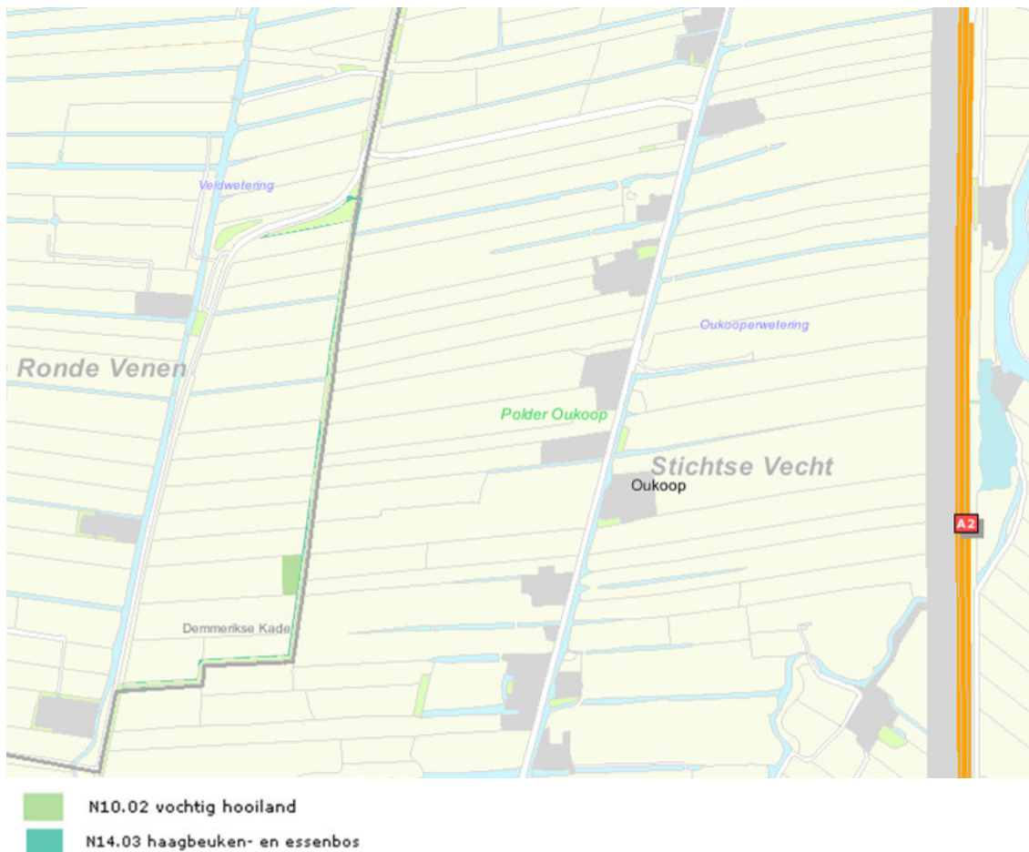
Natuurbeheerkaart 2011 met Demmerikse kade (Provincie Utrecht).

Gezien de constante achteruitgang in de schraallandvegetaties en het zeer kwetsbare karakter van de resterende vegetatie, dient gestreefd te worden naar uitbreiding van het monument en het inrichten van hydrologische bufferzones rond het gebied. Het gewenste beheer ten aanzien van de waterhuishouding is handhaving van een zo constant mogelijk, hoog waterpeil. Sloten dienen eenmaal per jaar, indien mogelijk eens per 2 à 5 jaar, geschoond te worden (Aanwijzingsbesluit, 1992).