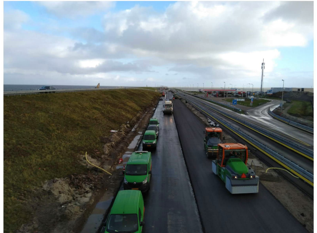
Wegwerkzaamheden rondom Breezanddijk