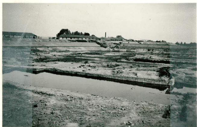
Afgraving "Spreeuwenhoek"; tekst pag. 74.