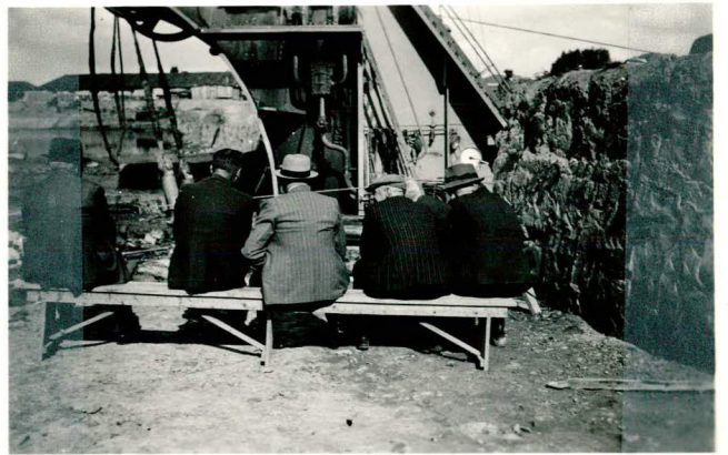
Het doorbaggeren van de boven- kade van de "Spreeuwenhoek"; tekst pag. 89.