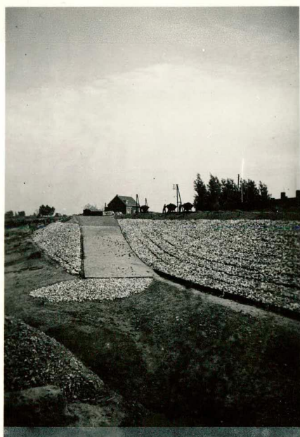
Veerstoep "Spreeuwenhoek" tekst pag. 73.