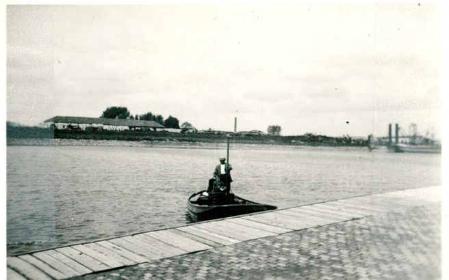
Veerstoep "Spreeuwenhoek"; tekst pag. 73.