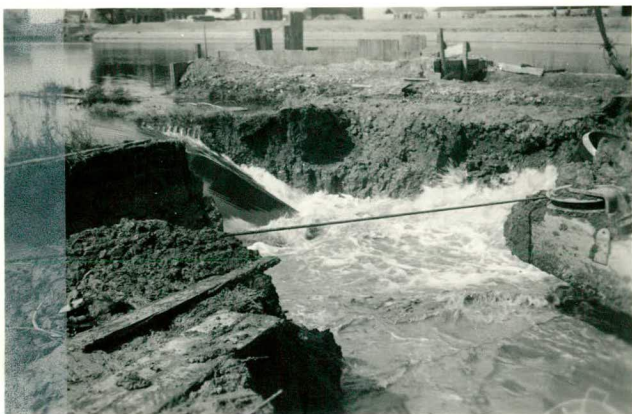
Het doorbaggeren van de boven- kade van de "Spreeuwenhoek"; tekst pag. 89.