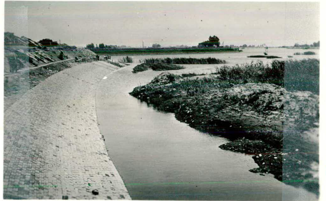
Glooiing van klinkerkeien R.O. "Spreeuwenhoek"; tekst pag. 84.