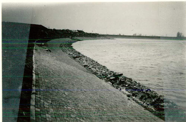
Glooiing van klinkerkeien R.O. "Spreeuwenhoek"; tekst pag. 84.