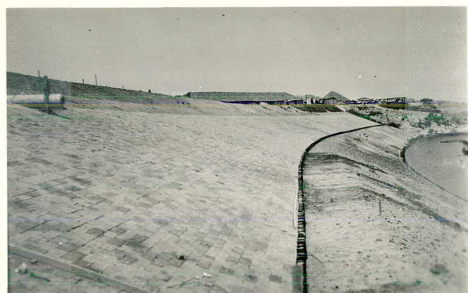
Glooiing van klinkerkeien R.O. "Spreeuwenhoek"; tekst pag. 84.