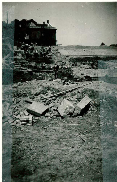
Afgraving "Spreeuwenhoek"; tekst pag. 74.