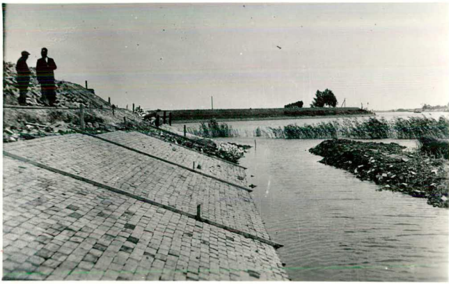
Glooiing van klinkerkeien R.O. "Spreeuwenhoek"; tekst pag. 84.