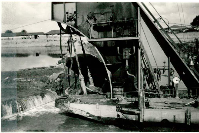
Het doorbaggeren van de boven- kade van de "Spreeuwenhoek"; tekst pag. 89.