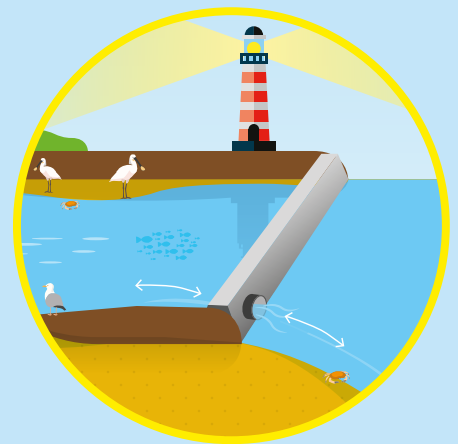
Herstel getijde dynamiek