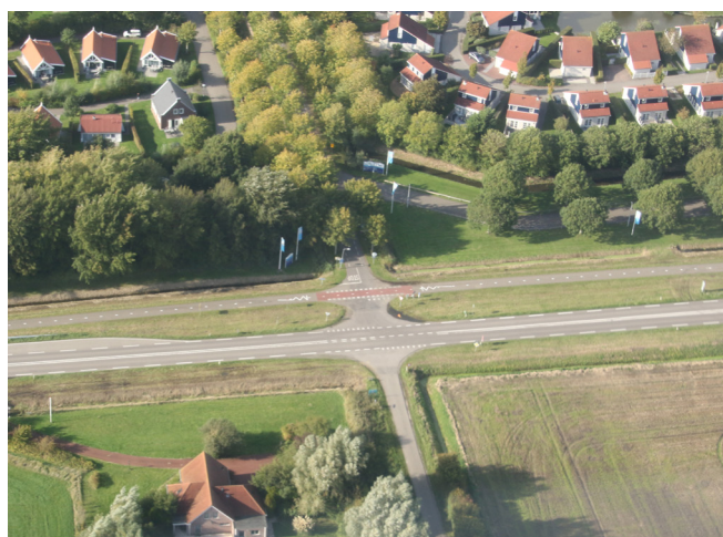
Huidige situatie Daleboutsweg

Kijk voor meer informatie op www.rijkswaterstaat.nl . Heeft u na het bekijken van de website nog vragen over het project? Stuur dan een mail naar rotondeszeeland@rws.nl of bel 0800 8002.