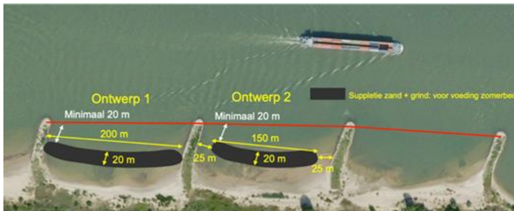
Figuur 2: Ruimtelijk principe ontwerp kribvaksuppleties

Deze kribvakken worden deels voorzien van een zanddrug die als zandmotor moet gaan werken. Of dit zo is, en op welke wijze dit de erosie van de bodem van de rivier kan voorkomen, zal na aanbrengen van het zand gemonitord worden. In clusters van 4 á 5 kribvakken zal zand aangebracht worden. Eind 2021 zal duidelijk zijn met welk materiaal en hoe de kribvakken gevuld zullen worden. De kribvaksuppletie staat gepland voor najaar 2022.