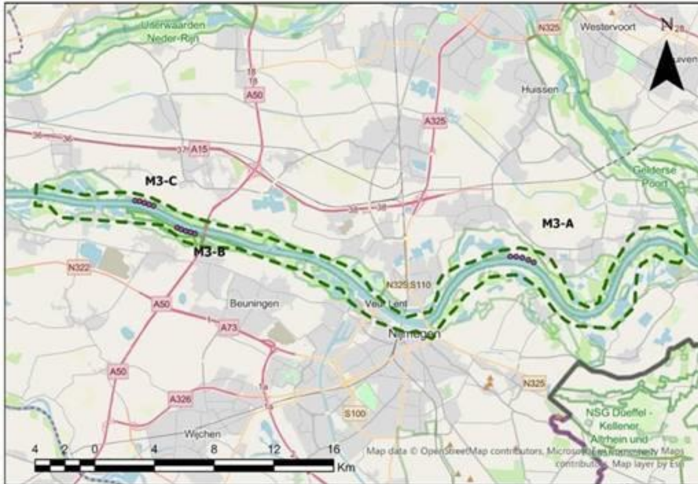
Figuur 1: Het plangebied (groen gestippeld) en specifieke werklocaties kribvakken (paarse stippen), van links naar rechts betreft het locaties M3-C, M3-B en M3-A

Deze kribvakken worden deels voorzien van een zanddrug die als zandmotor moet gaan werken. Of dit zo is, en op welke wijze dit de erosie van de bodem van de rivier kan voorkomen, zal na aanbrengen van het zand gemonitord worden. In clusters van 4 á 5 kribvakken zal zand aangebracht worden. Eind 2021 zal duidelijk zijn met welk materiaal en hoe de kribvakken gevuld zullen worden. De kribvaksuppletie staat gepland voor najaar 2022.