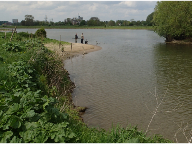
Beekmonding Linge bij Kuijkgemaal (Nederrijn)