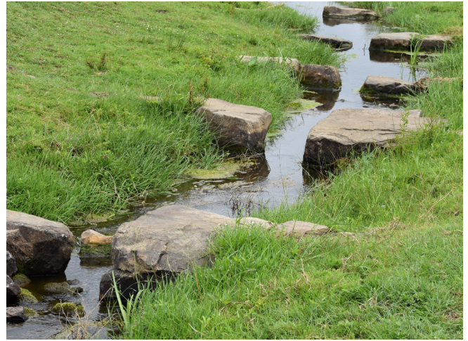
Vistrap in de monding van de Vlootbeek bij Linne in Limburg