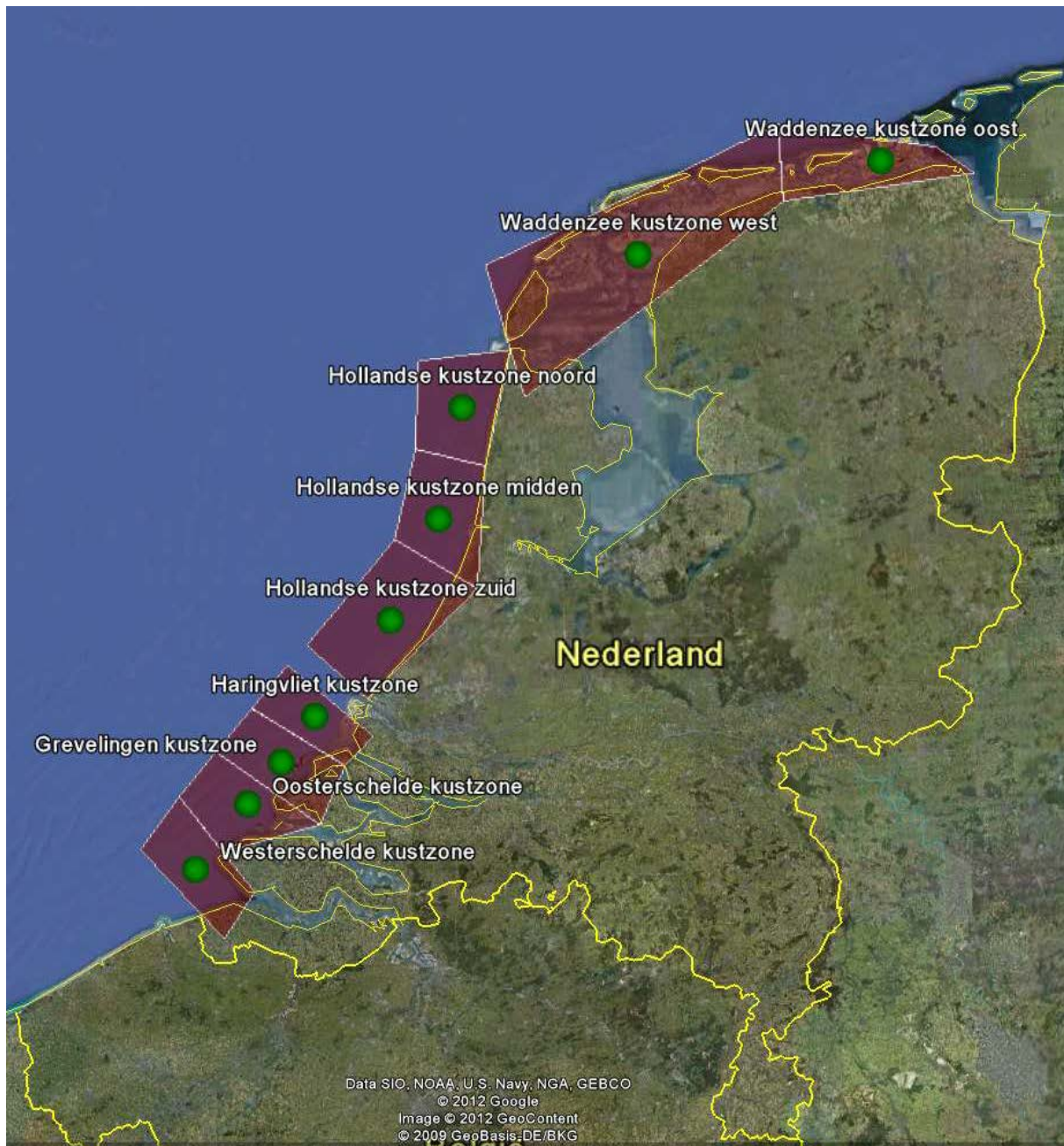
Figuur 1 Voorgestelde onderzoeklocaties in 2016 (uit Projectplan RWS 2015). De paarse vlakken geven de grenzen van de gebieden aan waarbinnen de slakken worden gezocht, de groene stippen het zwaartepunt van de locaties.