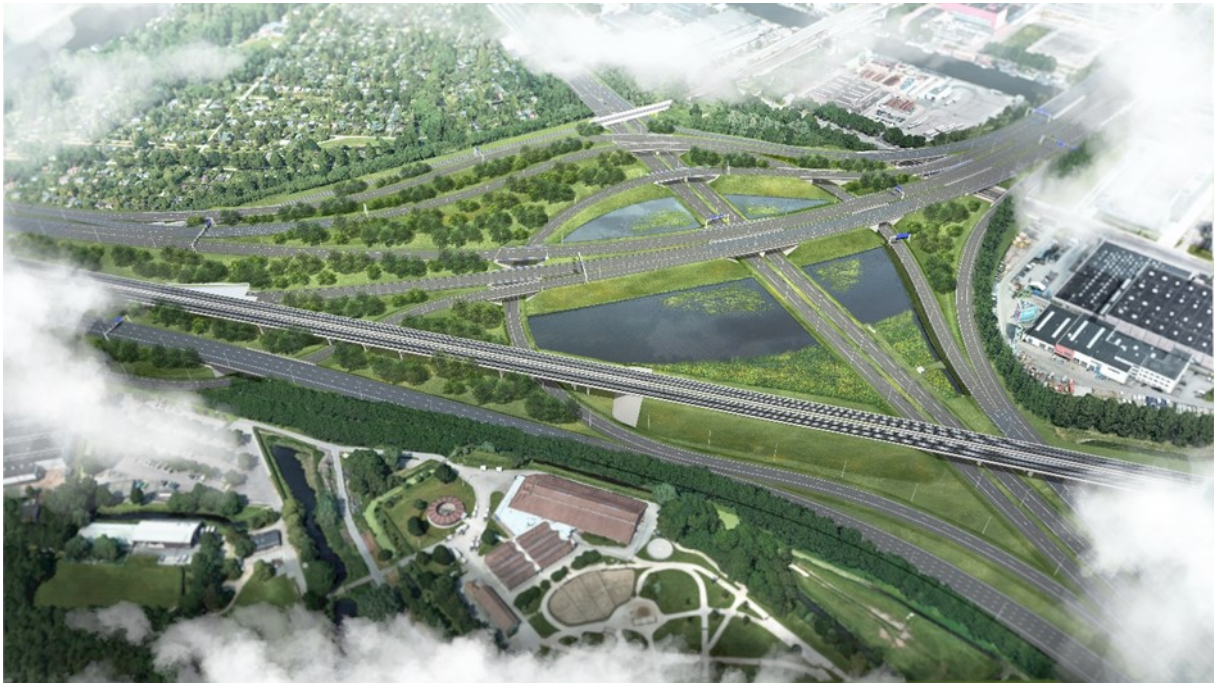
Figuur 1: artist impression.

Het project Reconstructie Knooppunt Amstel is een deelproject van project Knooppunten, één van de vier projecten die onderdeel uitmaken van het programma Zuidasdok (ZAD). De vier projecten van het programma ZAD zijn: