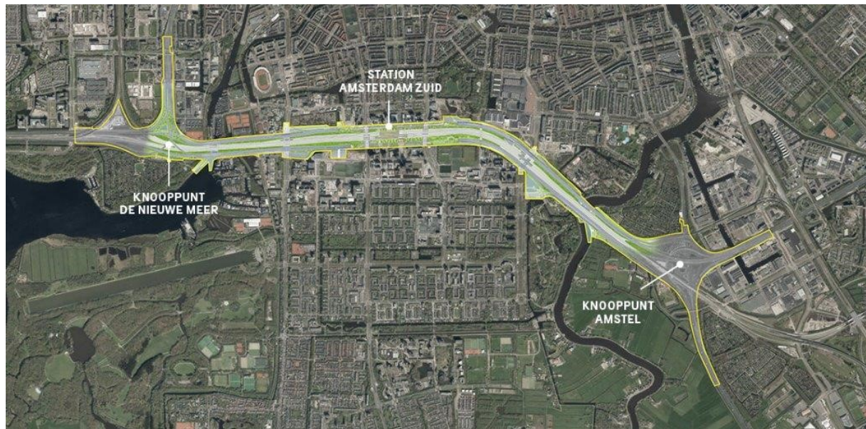
Figuur 3: projectgebied programma Zuidasdok.

Het project Reconstructie Knooppunt Amstel betreft het ombouwen van het knooppunt Amstel (t/m de aansluiting op de Europaboulevard (S109)).