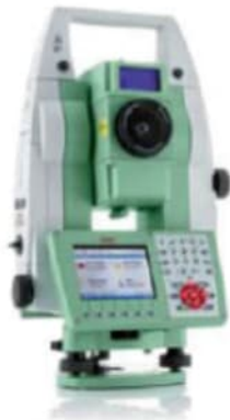
Figuur 5.6 / Robotic total station, RTS.

Met name voor de bewakingsfunctie van het monitoringssysteem is het belangrijk dat metingen zo snel mogelijk in de centrale database geplaatst worden. Uit ervaring blijkt dat RTS'en werken met meetcycli waarbij de verzamelde meetdata eens per uur wordt geüpload naar de server. Ervan uitgaand dat deze handeling en eventueel noodzakelijke bewerkingen meteen worden uitgevoerd, dan is de maximale vertraging tussen een meettijdstip en de beschikbaarheid van de gegevens circa een uur. Dit blijkt in de praktijk acceptabel.