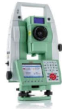
Figuur 5.6 / Robotic total station, RTS.

Foto 1 en 2: Prisma's (links) en robotic total stations.