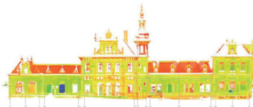
Figuur 3: Voorbeeld Puntenwolk van 3D-scan bestaande stationsgebouw

Wanneer een nog volledig beeld van de zakkings binnen een deelgebied gewenst is kan men door middel van hernieuwde 3D-scans hier een invulling aan worden geven. Hoogtechnologische scanners registreren honderdduizenden punten per seconde. Elk punt is een duidelijke millimeternauwkeurige XYZ-meting in kleur. Al deze punten samen vormen een soort van fotorealistische puntenwolk waarbinnen je kunt navigeren en die de werkelijke situatie weergeeft. Wanneer deze inmeting op een later tijdstip herhaald wordt, kan men een vergelijking maken van beide scans en zodoende een beeld krijgen van alle deformaties die over de algehele constructie zijn opgetreden in de tussenliggende tijd. Bij deze techniek van monitoren wordt dus de gehele tunnel in XYZ-metingen gescand en zal het specifiek voor het opdrijven van een moot een overdosis aan informatie opleveren die het doel voorbij schiet. Deze meettechniek is wel interessant als je van een bestaande tunnel met al zijn installaties een soort fotoprint wil hebben van de as-built situatie bijvoorbeeld voorafgaand aan een renovatie.