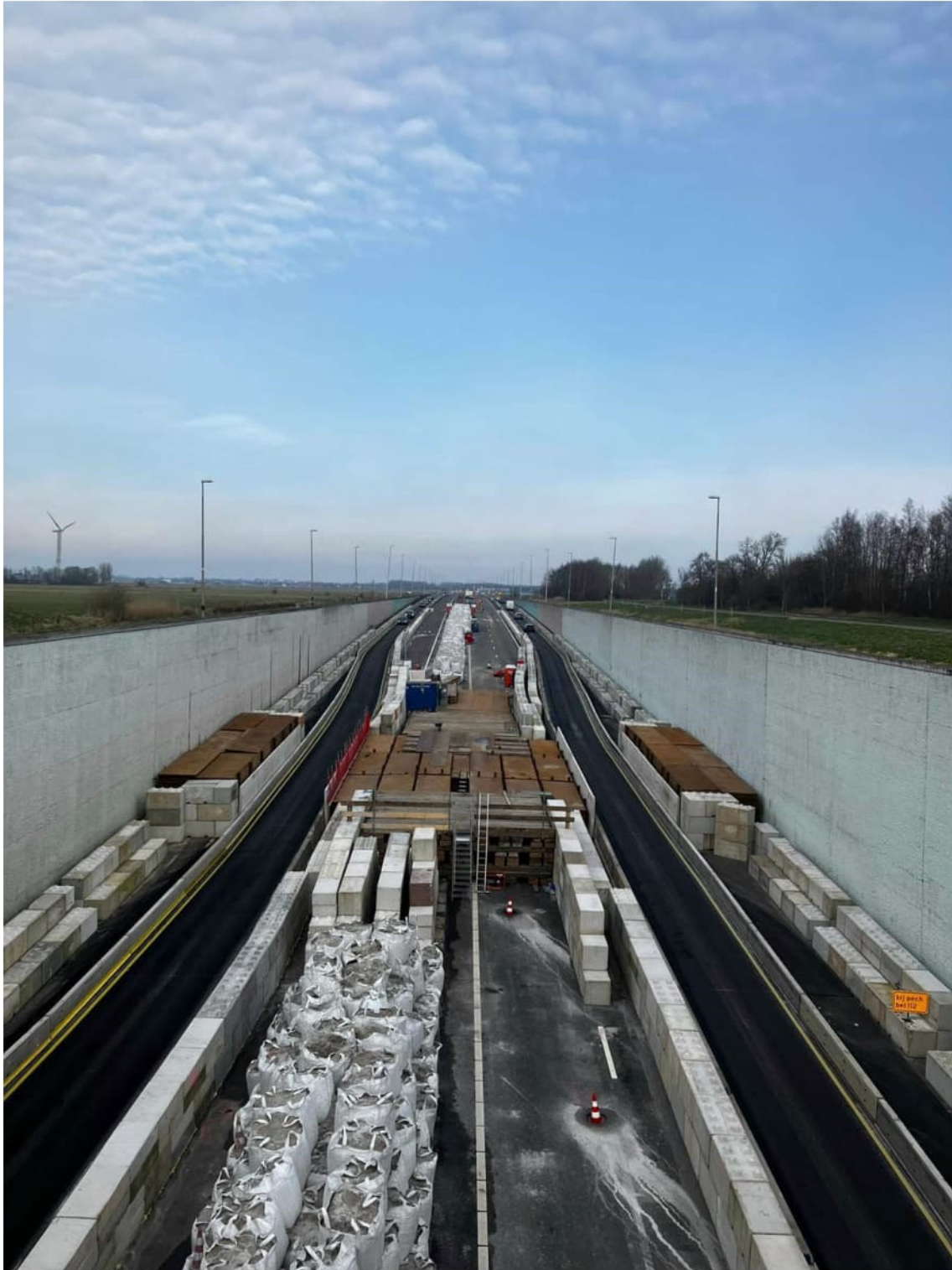
Overzicht richting Sneek vanaf de trappen