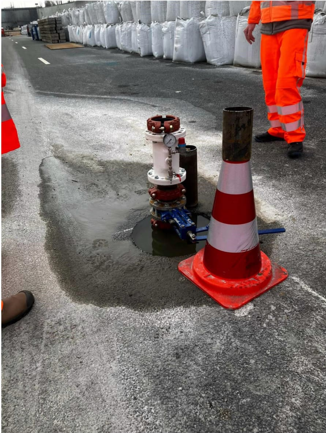
Sluisjesconstructie ten behoeve van de sonderdering door de vloer (tegen de waterdruk)