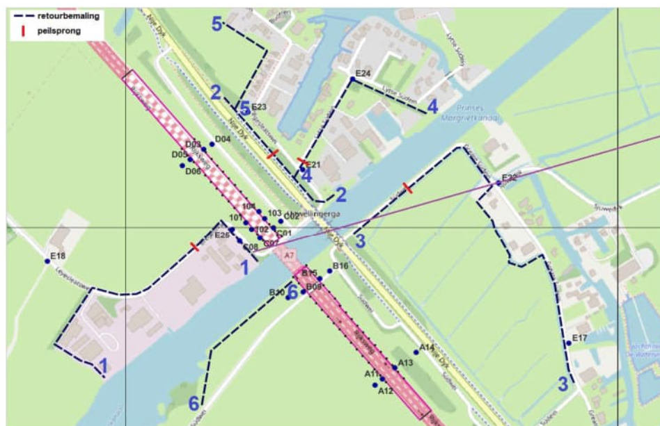
Locatie infiltratiedrains onder de Holocene deklaag buizen met een natte omtrek van ruim 1 m