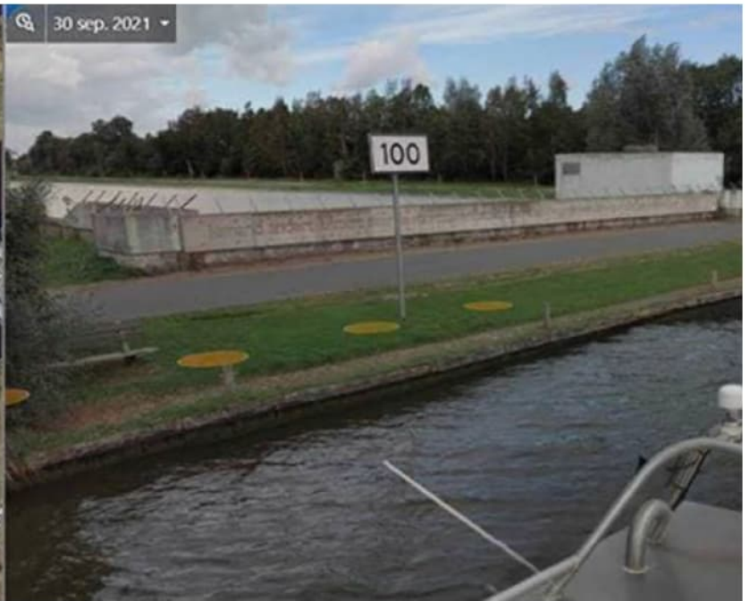
Foto's zuidzijde (door de stand van de zon wat minder goed zichtbaar):