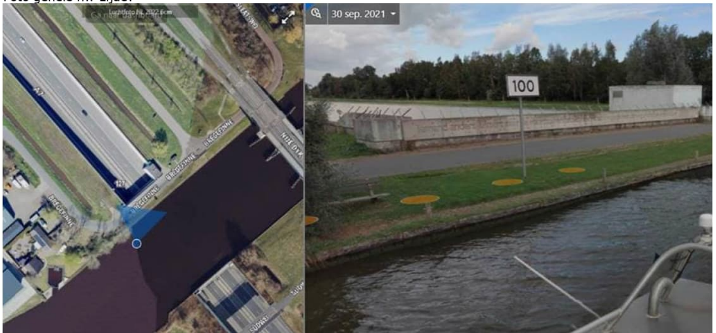
Foto's zuidzijde (door de stand van de zon wat minder goed zichtbaar):