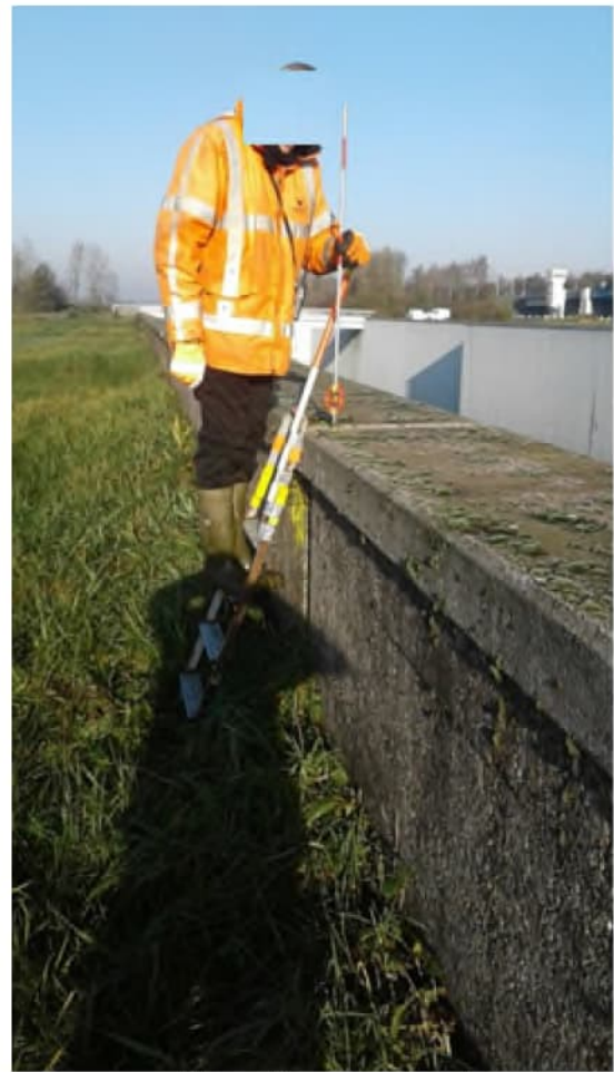
Opname van een deformatiemeetpunt met een trapje