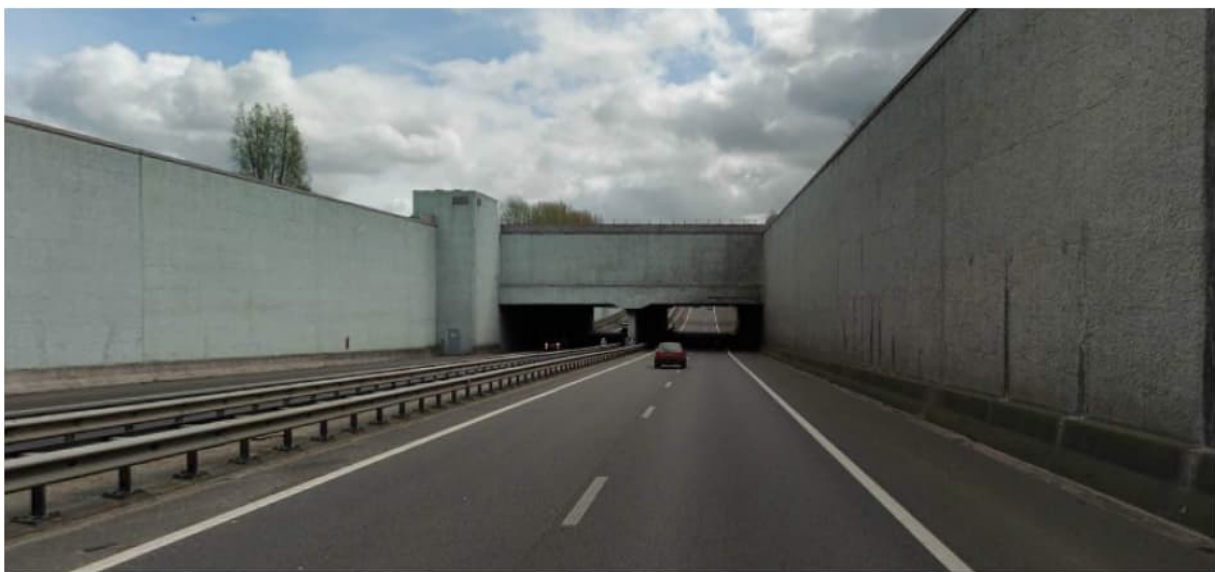
Aquaduct Prinses Margrietunnel gezien vanuit het Noorden