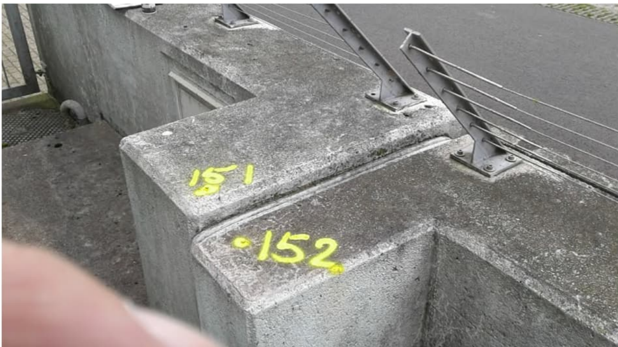
Deformatiemeetpunten 151 en 152