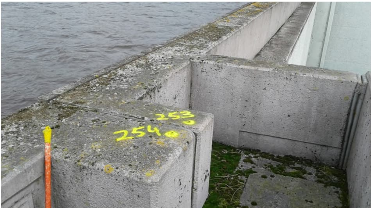
Deformatiemeetpunten 253 en 254