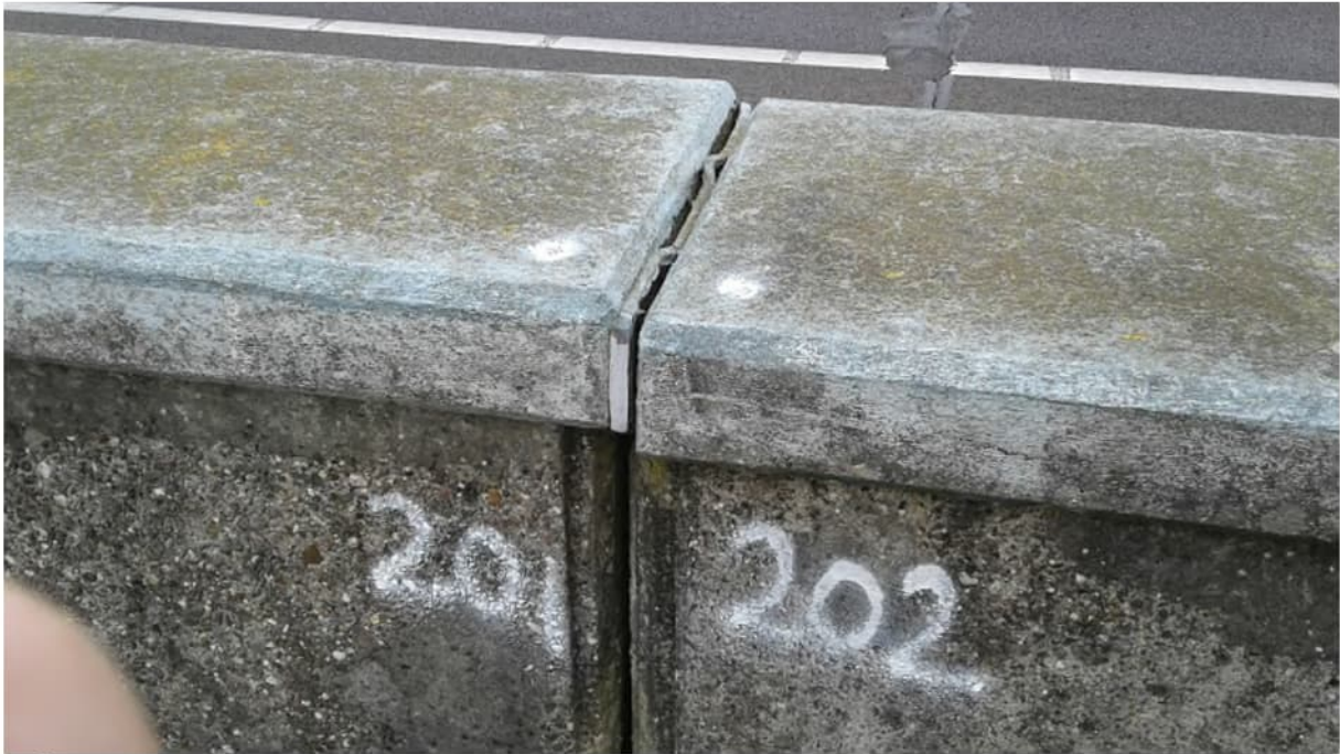
Deformatiemeetpunten 201 en 202