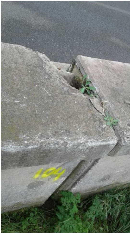
Betonrot bij deformatiemeetpunt 104

Onderstaande foto's overgenomen uit vorig meetrapport