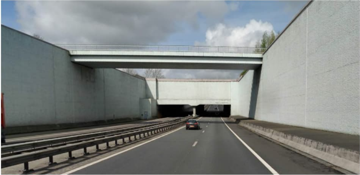
Aquaduct en Viadukt Prinses Margriettunnel gezien vanuit het Zuiden