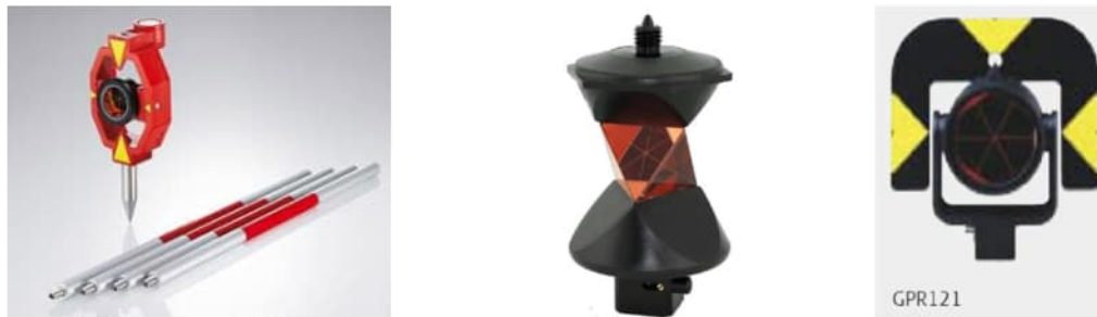
De gebruikte prisma's (links GMP111 miniprisma, midden GRZ122 360° prisma, rechts GPR121 rondprisma) bij deze deformatiemeting

Voor het inmeten van de deformatiemeetpunten is een kort meetstaafje gebruikt i.c.m. een Leica GMP111 miniprisma (prismaconstante +17.5 mm). Voor de richtpunten 2001 t/m 2015 zijn statieven met stelschroevenblokken gebruikt i.c.m. een Leica GRZ122 360° prisma (prismaconstante +23.1 mm). De Leica GPR121 rondprisma (prismaconstante 0 mm) is gebruikt i.c.m. statieven en stelschroefblokken bij de overige richtpunten.