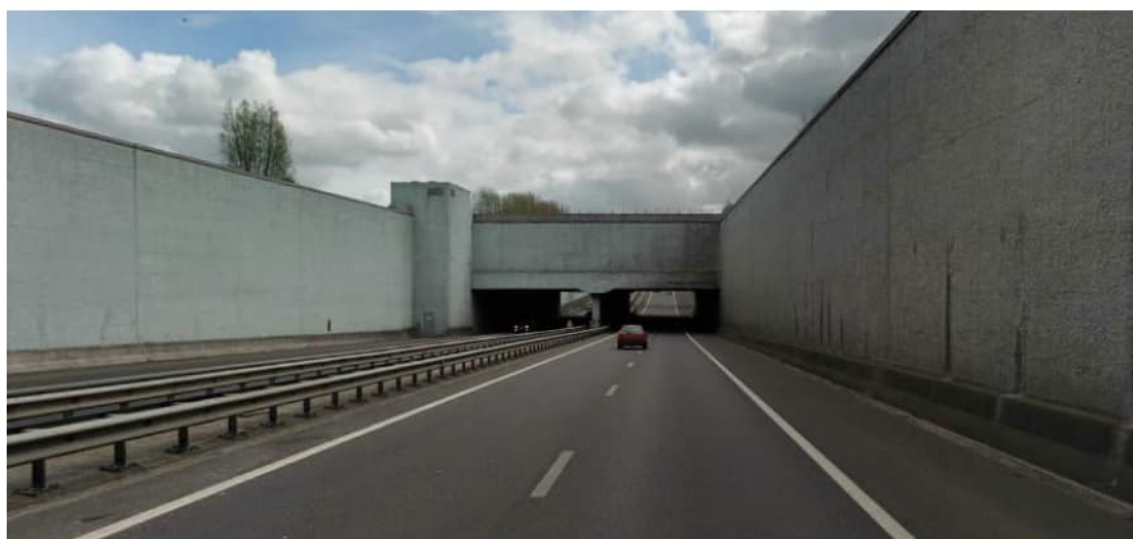
Aquaduct Prinses Margriettunnel gezien vanuit het Noorden