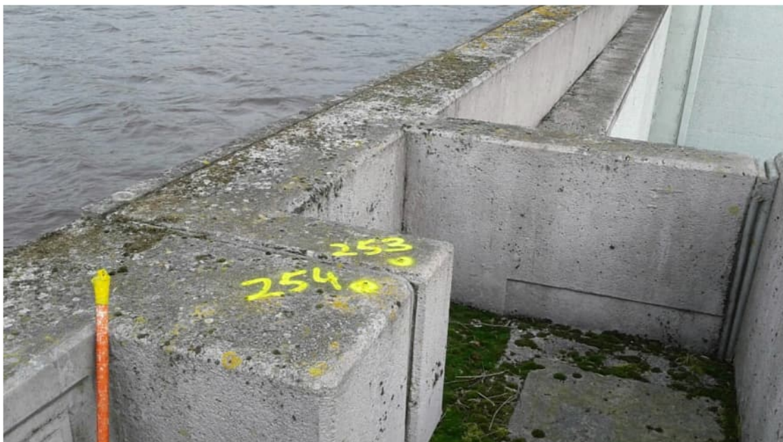
Deformatiemeetpunten 253 en 254