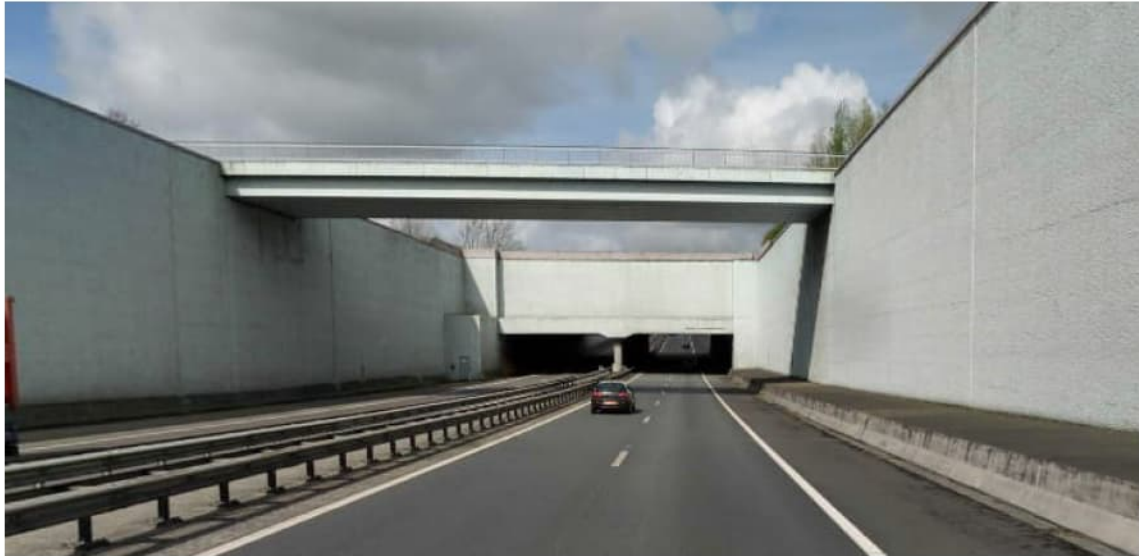
Aquaduct en Viadukt Prinses Margrietunnel gezien vanuit het Zuiden