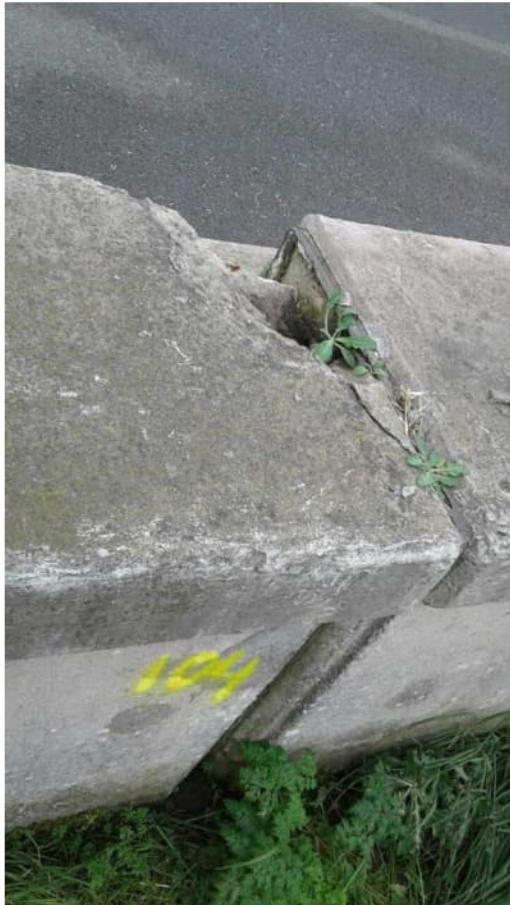
Betonrot bij deformatiemeetpunt 104

Onderstaande foto's overgenomen uit vorig meetrapport