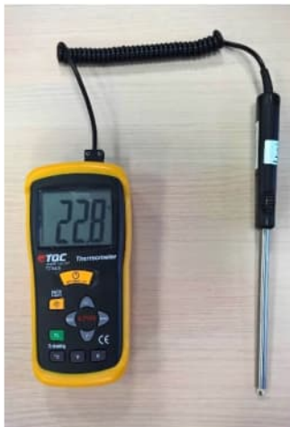
Thermometer TQC TE1000

Zowel de temperatuur van de lucht en de constructie zijn uit de wind en uit de zon gemeten.