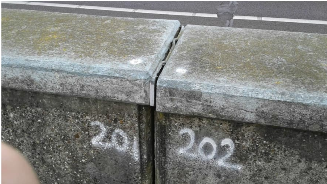
Deformatiemeetpunten 201 en 202