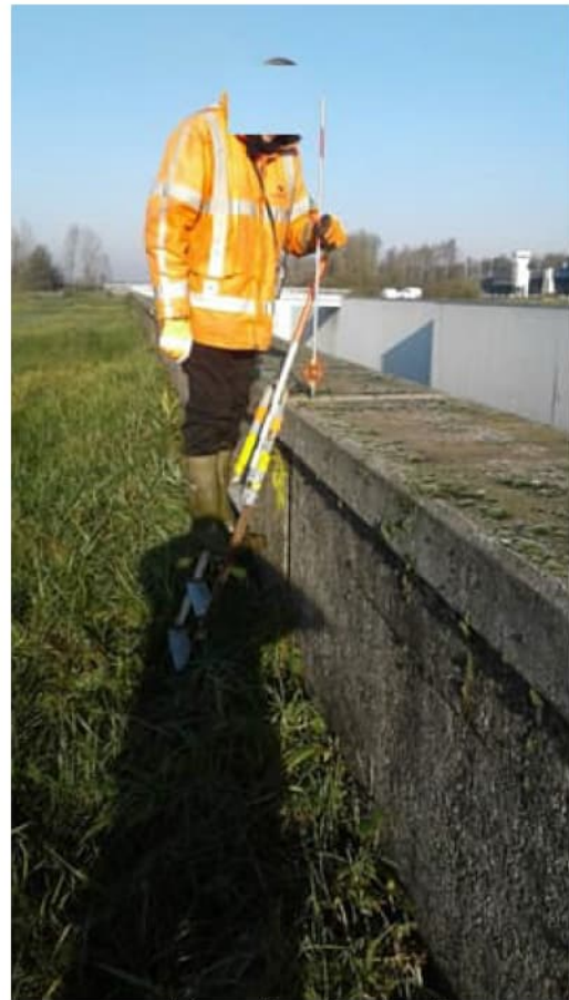
Opname van een deformatiemeetpunt met een trapje