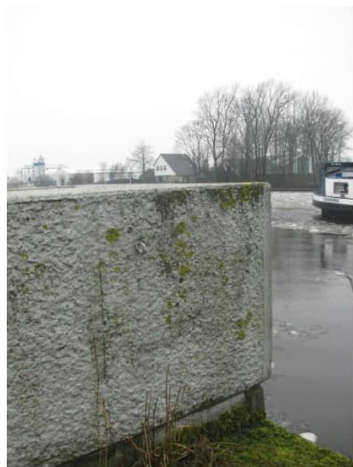
Bevestigingsogen voor de valbeschermingen aan de weg langs het kanaal over de tunnel (links) en aan de kant van de tunnel onder het kanaal (rechts)