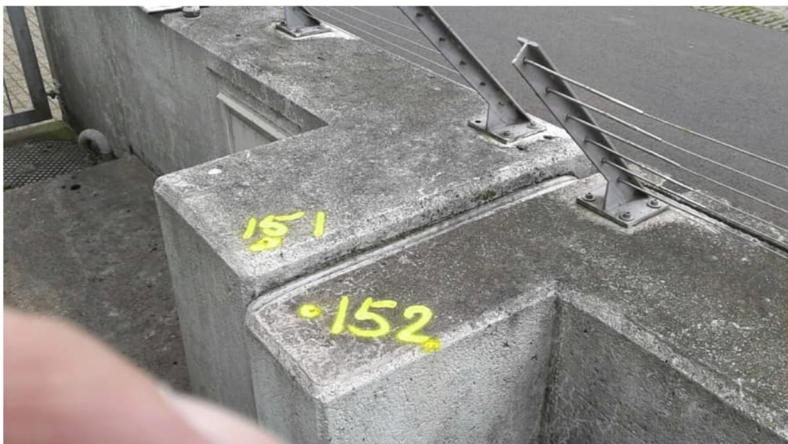
Deformatiemeetpunten 151 en 152