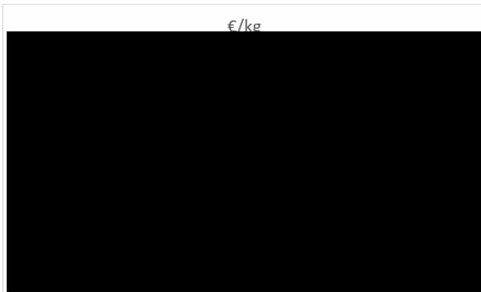
Grafiek 3: verloop van de prijs/kg in de periode 2018 (1) – 2022 (5)