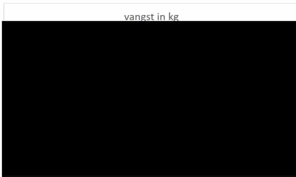
Grafiek 1: verloop van de vangst in de periode 2018 (1) – 2022 (5)