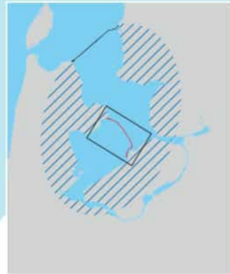
Beschermende werking Houtribdijk in Nederland

De Houtribdijk functioneert bij storm als een grote golfbreker tussen IJsselmeer en Markermeer. De dijk is daarmee cruciaal voor de water- veiligheid van alle provincies rond het IJsselmeergebied. Ook verbindt de Houtribdijk Lelystad en Enkhuizen voor fietsers en autoverkeer. Rijkswaterstaat versterkt de dijk in samenwerking met de provincie Flevoland, zodat deze weer lang meekan en grotere stormen kan weerstaan. Ook komen er nieuwe kansen voor natuur en recreatie. Het project is onderdeel van het Hoogwaterbeschermingsprogramma, het landelijke programma waarin Rijkswaterstaat en de waterschappen samenwerken om Nederland te beschermen tegen hoogwater. In 2020 is het project afgerond. Meer informatie: www.rijkswaterstaat.nl/versterkinghoutribdijk