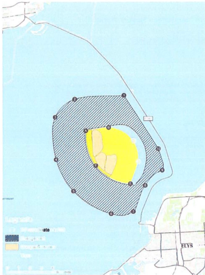
Figuur 2, ruimtelijke afbaking conform projectplan water