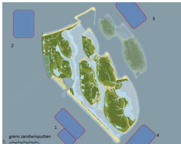
Figuur 1: overzicht Marker Wadden en zandwinputten.

Voor de aanleg van de Marker Wadden wordt uit 4 putten (zie figuur 1) holoceen en zand gewonnen en is een slibgeul aangelegd. De putten maken onderdeel uit van het onderwaterlandschap en zijn ruimtelijke afgebakend, zie bijlage 1 (figuur 2 en 3).