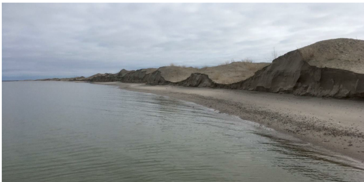
Erosie Noord-strand door de stormen van februari en maart 2020

Kennen jullie Ciara nog? Het was de naam van de storm die begin februari met een windkracht 9 tot en met 12 over Nederland trok. Het was de opmaat van een onstuimig winterseizoen. In de periode tussen begin februari en half maart 2020 trokken meerdere stormen over het land. In combinatie met sterk verhoogde waterstanden van het Markermeer hebben de stormen voor een sterke erosie van een deel van de stranden en dammen gezorgd. De afgekalfde stranden zijn eind 2020 aangevuld. Het volgen van de ontwikkeling van de stranden is onderdeel van het onderzoeksprogramma KIMA.