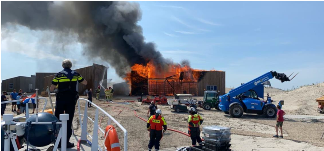
De beheerschuur gaat in vlammen op.

Op 17 juni, kort voor de geplande opening van de nederzetting, is de werkschuur afgebrand. De brand is ontstaan in het gedeelte waar de accu's voor het eiland geïnstalleerd werden. Met het verlies van de werkschuur zijn ook de nutsvoorzieningen verloren gegaan. In twee weken tijd is met een aantal noodvoorzieningen stroom, drinkwater en de riolering weer aangesloten waardoor de geplande opening op 2 juli alsnog doorgang kon vinden. Het herstellen van de brandschade en weer up to date krijgen van de nutsvoorzieningen kan naar verwachting worden afgerond in het eerste kwartaal van 2021.