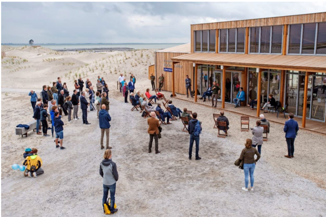
De nederzetting werd op 2 juli 2020 geopend.