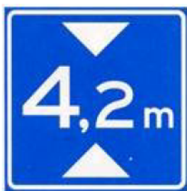
Bord L1 (hoogte onderdoorgang)

Voor de doorrijhoogte van 4,33 m is geen bord nodig. Indien men wel een bord wil plaatsen dan kan dit bord L1 zijn. De uitvoeringsvoorschriften BABW zegt daar het volgende over: