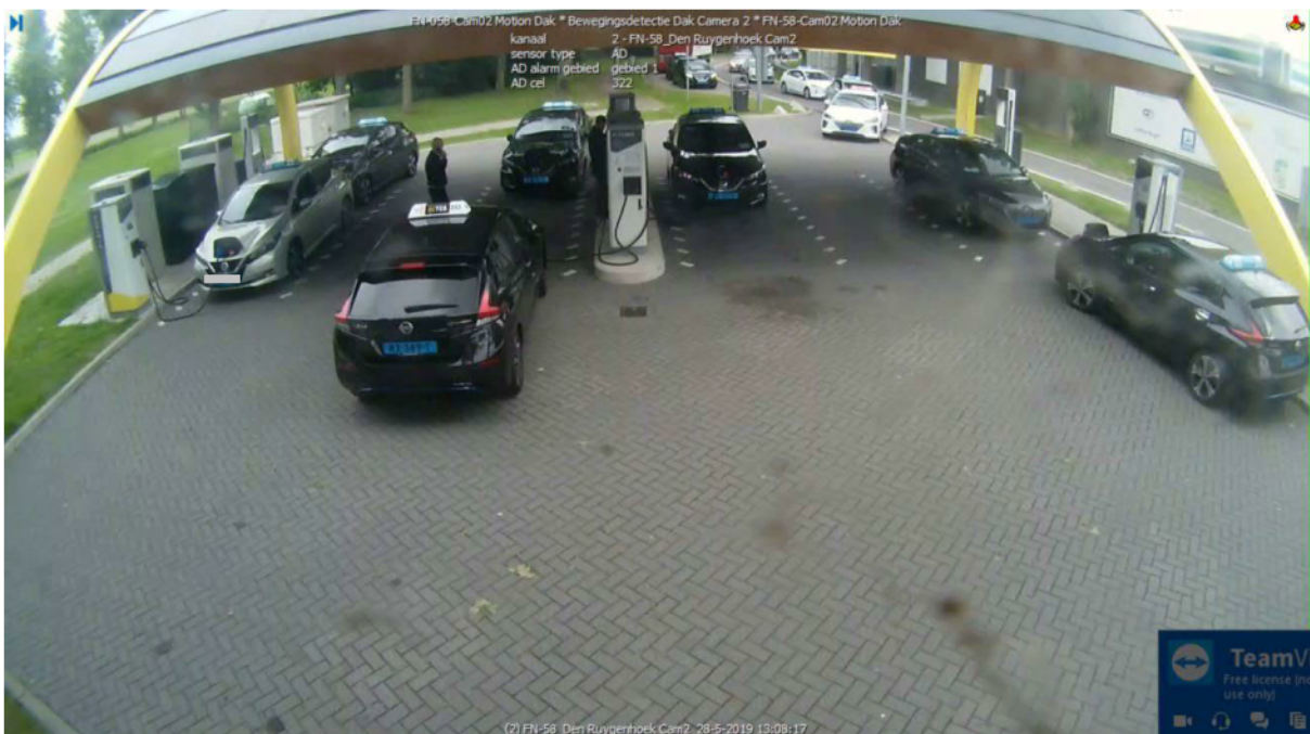
Wachtrij op locatie Ruygenhoek West. Zie ook de geparkeerde voertuigen op de vrachtwagen parkeerstrook.