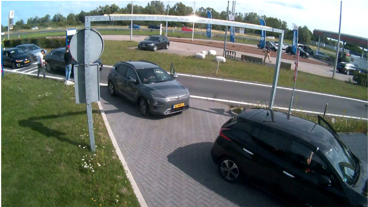
Wachtrij op locatie Aalscholver, met al meerdere stilstaande voertuigen op de doorgaande weg.