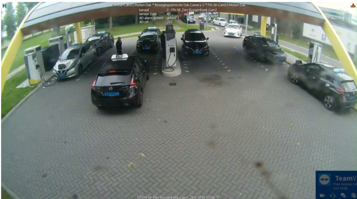
Wachtrij op locatie Ruygenhoek West. Zie ook de geparkeerde voertuigen op de vrachtwagen parkeerstrook.