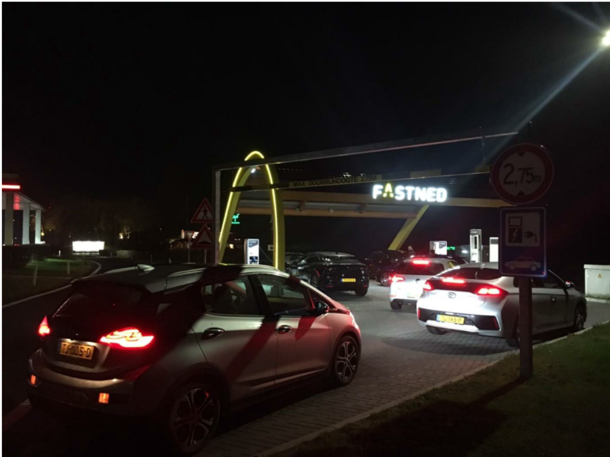
Wachtrij op locatie De Lepelaar. De laatste auto blokkeert de ingang van het laadstation.