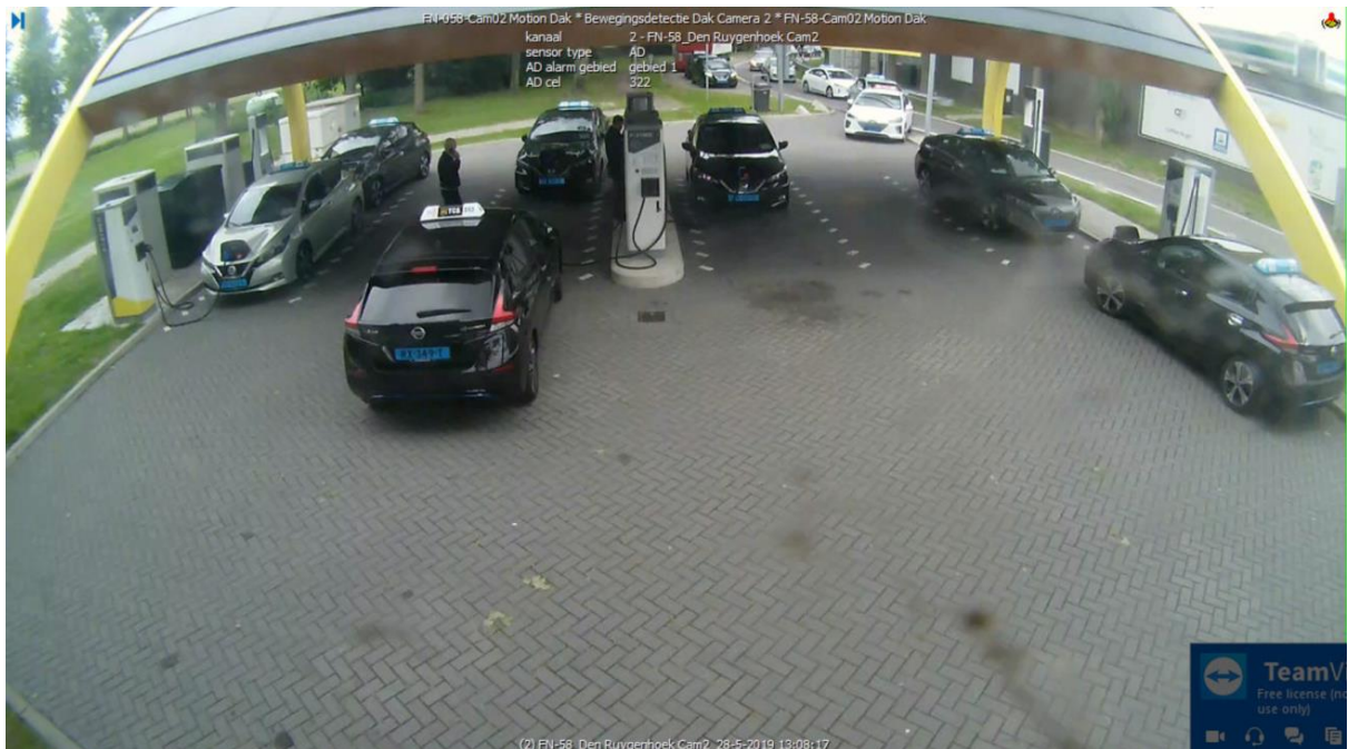
Wachtrij op locatie Ruygenhoek West. Zie ook de geparkeerde voertuigen op de vrachtwagen parkeerstrook.