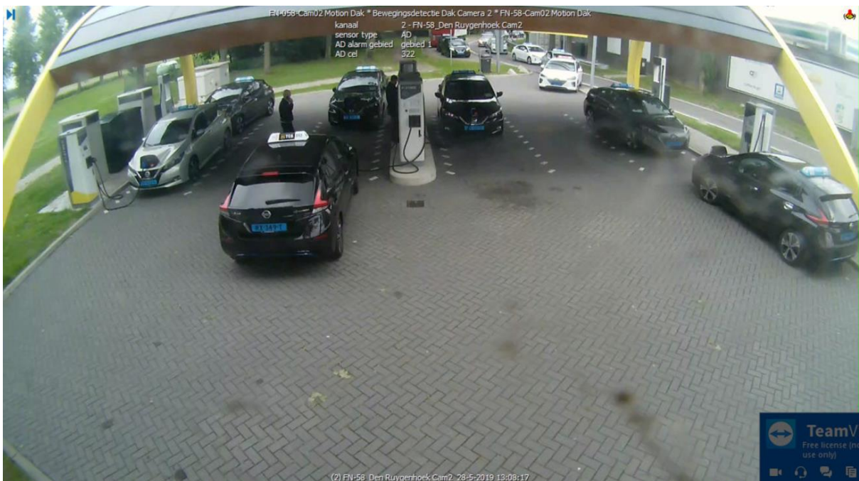
Wachtrij op locatie Ruygenhoek West. Zie ook de geparkeerde voertuigen op de vrachtwagen parkeerstrook.