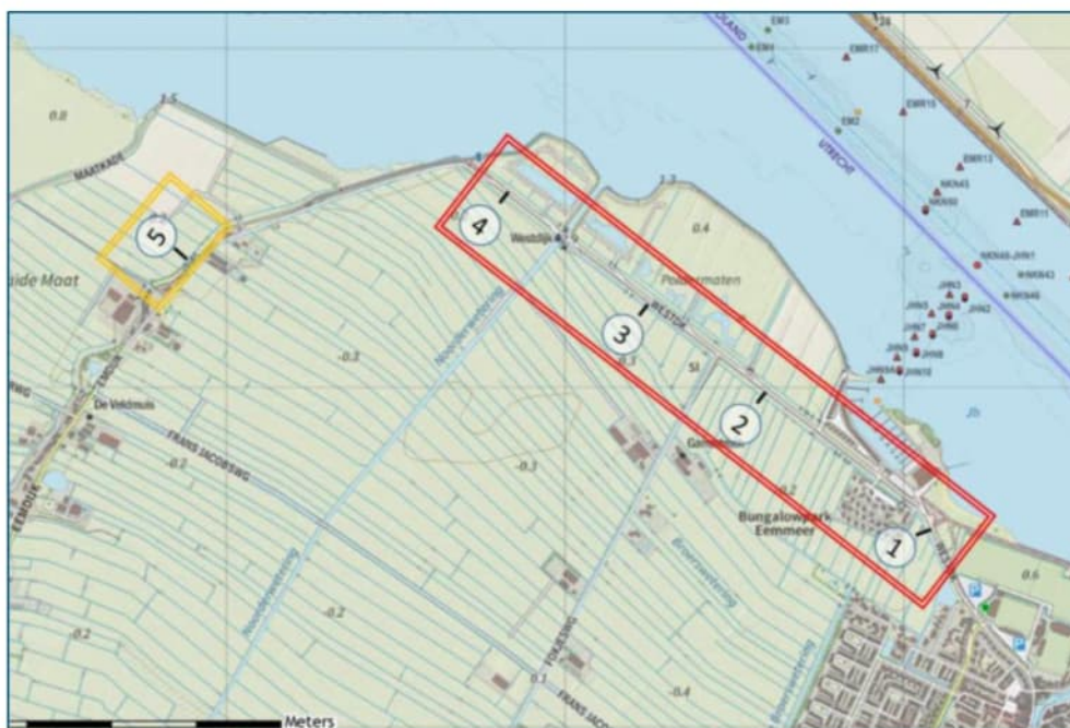
Figuur 1 Locatie toepassing

Het Waterschap Vallei & Veluwe (WSVV) heeft aan de Eemdijk in 2016 (uitvoering) en 2017 (afwerking) een dijkversterking uitgevoerd door de binnenberm te vergroten. In de kern van de aanberming is thermisch gereinigde grond (TGG) toegepast, als bekleding is klei toegepast. De TGG is onder certificaat toegepast als grootschalige bodemtoepassing (GBT) zoals is beschreven in het Besluit bodemkwaliteit (Bbk) en de technische uitwerking daarvan de regeling bodemkwaliteit (Rbk). In Figuur 1 is de locatie met de toepassing aangegeven.