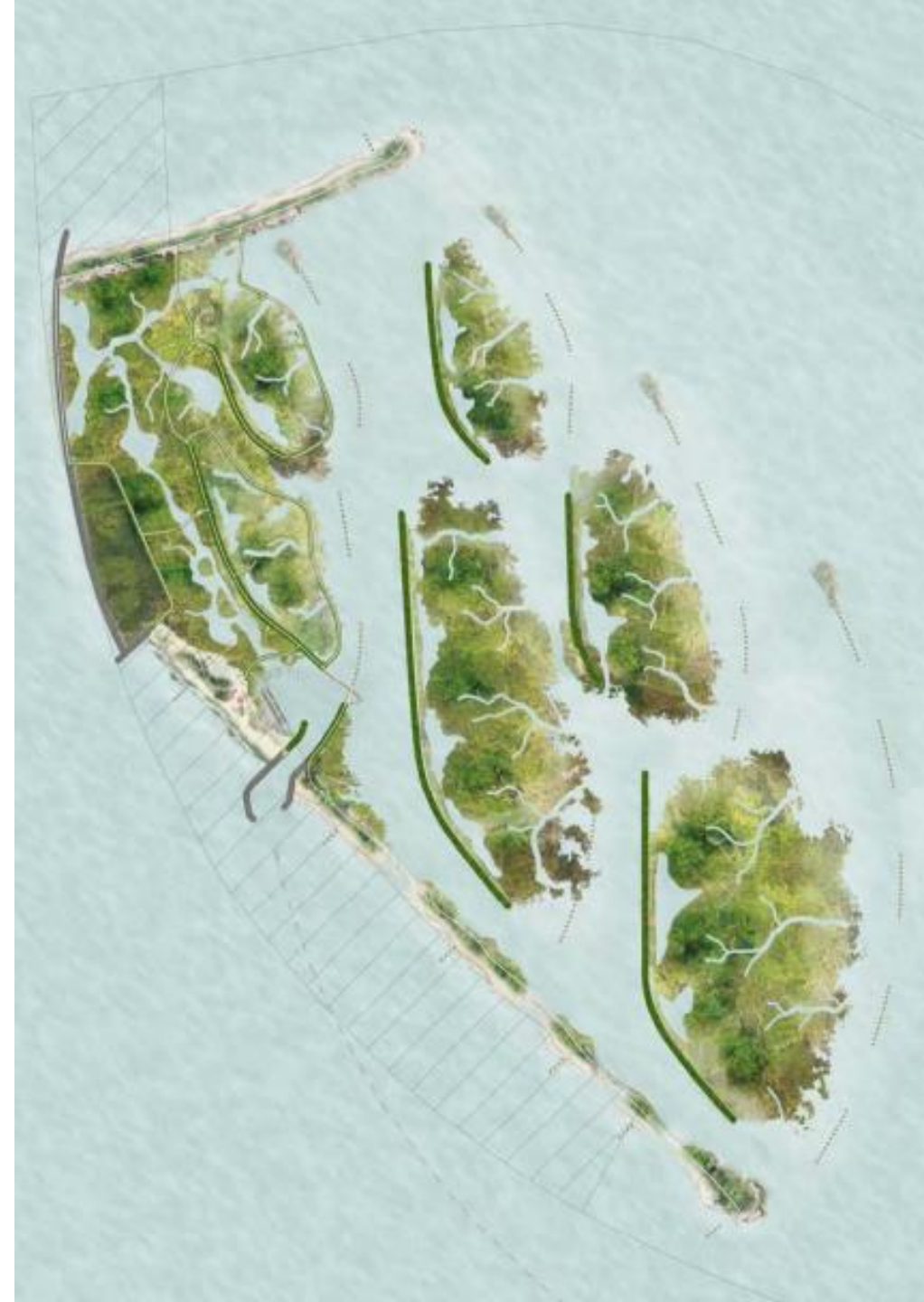
Figuur 2 – Layout van Marker Wadden [B]

Het haveneiland – één van de vijf eilanden – is toegankelijk voor publiek en bereikbaar per boot. Er is een veerdienst en plek voor een beperkt aantal boten om aan te meren in de haven. Het haveneiland kent één horecavoorziening (strandpaviljoen) en een aantal huisjes waar bezoekers kunnen overnachten. Verder zijn er veel wandelpaden en uitkijkpunten voor natuurliefhebbers te vinden. De overige vier eilanden zijn niet voor het publiek toegankelijk. Hier rusten, foerageren en broeden vogels.