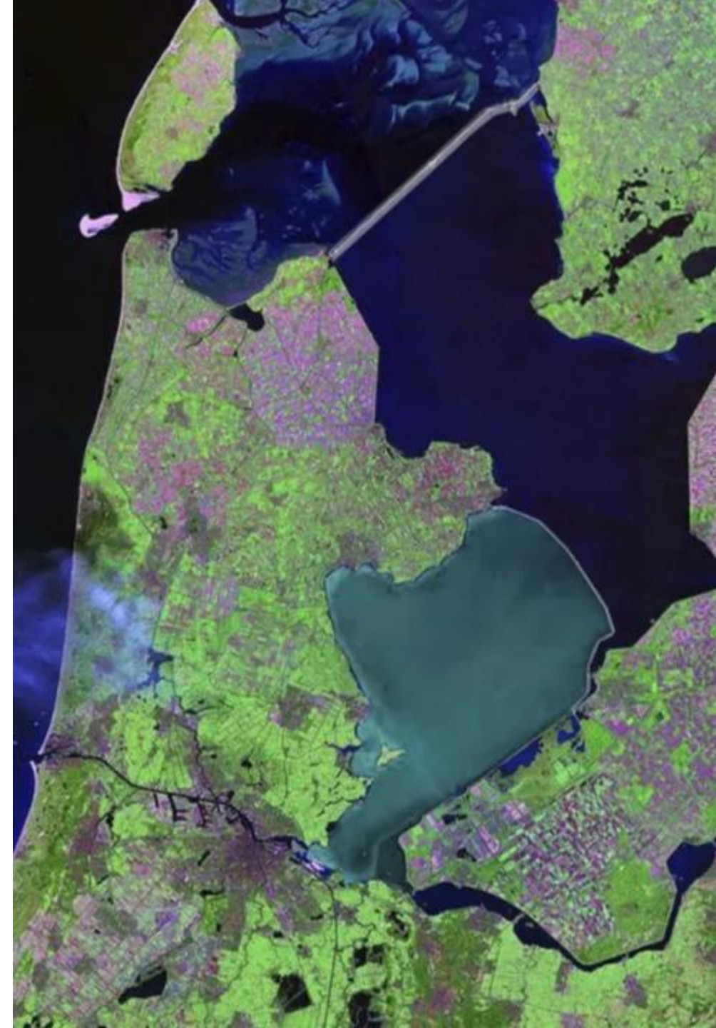
Figuur 1 – Bovenaanzicht troebel Markermeer [A]

Op 31 december 2020 is Marker Wadden (de eerste fase) officieel opgeleverd. De verlenging van de eerste fase is nu in realisatie. De beleidsevaluatie Marker Wadden moet inzicht geven in het algehele slagen van het project en eventuele leerpunten voor toekomstige, soortgelijke projecten. Dit document bevat de uitkomsten van de beleidsevaluatie.