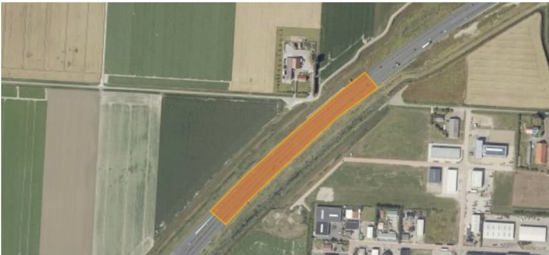
Figuur 2.4 Luchtfoto 2019, West-Groeneweg, Steenberg t.h.v. km 222.8. In oranje de IBC-toepassing van AEC-bodemas.

Tegen het talud is over circa 20 meter een betonnen keerwand aangebracht om afschuiven te voorkomen (zie foto 4.2). Tijdens de inspectie zijn geen grote deformaties in het wegtalud gezien. Ter hoogte van het bezochte punt is de bermsloot over te steken om het schouwpad te betreden. Het schouwpad was ten tijde van het bezoek niet dicht begroeid en goed begaanbaar. Het deel waar mogelijk TGG is toegepast is echter makkelijker te bereiken via Zeelandweg-Oost.