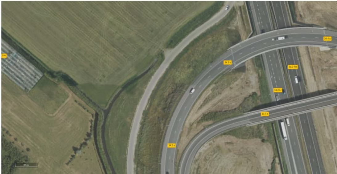
Figuur 6.1 Luchtfoto 2019

In bijlage 5 zijn foto's opgenomen die zijn gemaakt tijdens de veldinspectie.