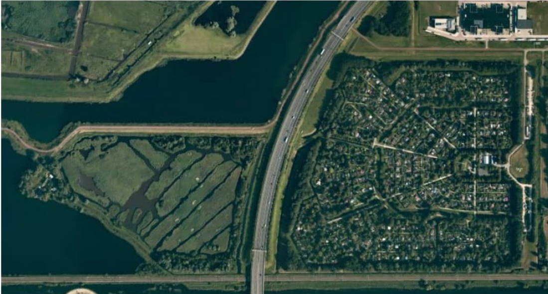
Figuur 3.4 Luchtfoto 2019, Vak E, Westrandweg t.h.v. km 12.1 tot km 12.4.