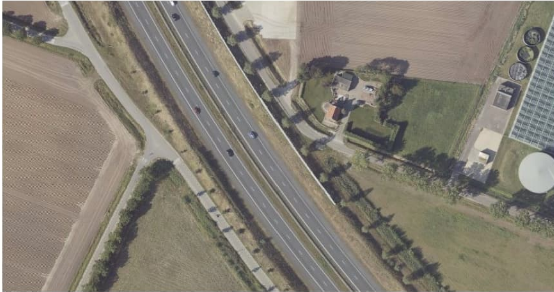
Figuur 2.2 Luchtfoto 2019, Hoek Stierenweg/Zoekweg, Steenbergen t.h.v. km 226.8.