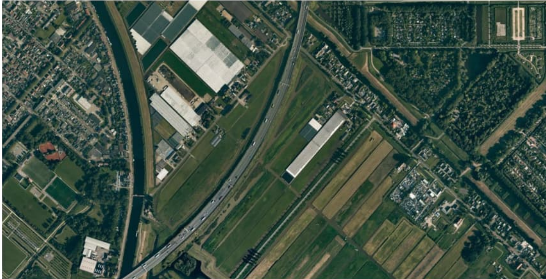
Figuur 3.2 Luchtfoto 2019, Vak C, Westrandweg t.h.v. km 10.1 tot km 11.3.