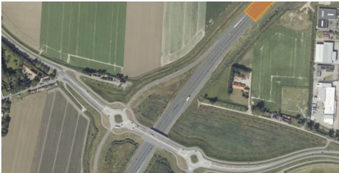
Figuur 2.3 Luchtfoto 2019, Zeelandweg-Oost, Steenbergen t.h.v. km 223.4. In oranje de IBC-toepassing van AEC-bodemassas.

Tussen km 223.1 en km 223.4 is, op basis van foto's die zijn genomen tijdens de aanleg, mogelijk TGG toegepast als ophoogmateriaal zowel ter plaatse van de A4 als de afrit. De locatie is bezocht aan de zuidzijde van de A4. Tijdens de inspectie zijn geen grote deformaties in het wegtalud gezien. Het schouwpad was kort gemaaid en goed begaanbaar. Langs het schouwpad is een watergang aanwezig (zie foto 3.1). Het water vertoonde geen afwijkende kleur. Zeelandweg-Oost is aan beide zijden van de A4 een doodlopende straat waar makkelijk geparkeerd kan worden.