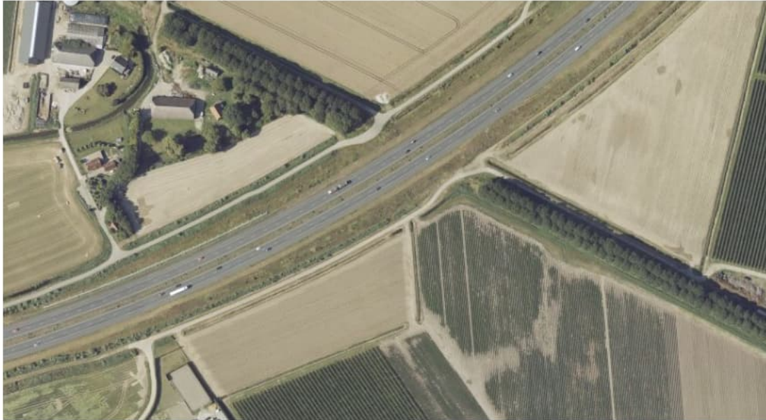
Figuur 2.5 Luchtfoto 2019, Triangel, Steenbergen t.h.v. km 218.4.