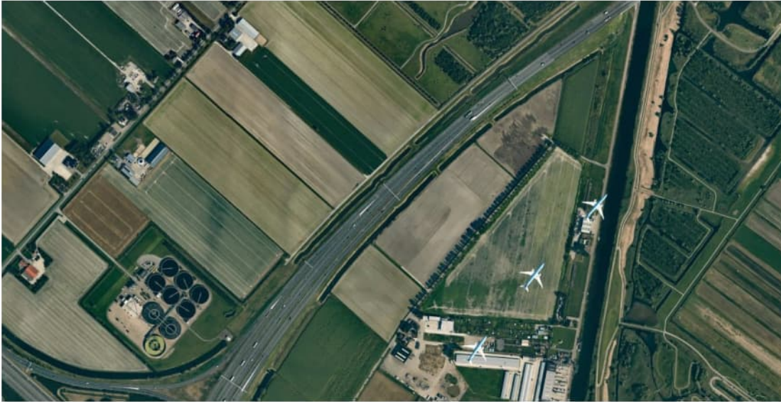
Figuur 3.1 Luchtfoto 2019, Vak B, Westrandweg t.h.v. km 218.4.

Door de medewerkers van Rijkswaterstaat werd vermeld dat nabij het knooppunt Raasdorp na de realisatie van het werk nog zettingen zijn opgetreden in dien mate dat het nodig was om de rijbaan weer af te vlakken.