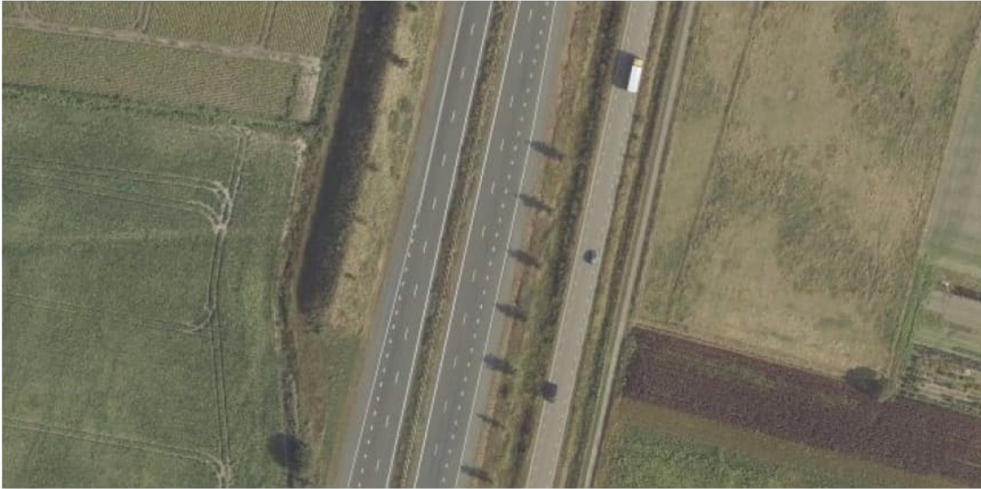
Figuur 2.1 Luchtfoto 2019, Laageinde, Bergen op Zoom t.h.v. km 228.7.