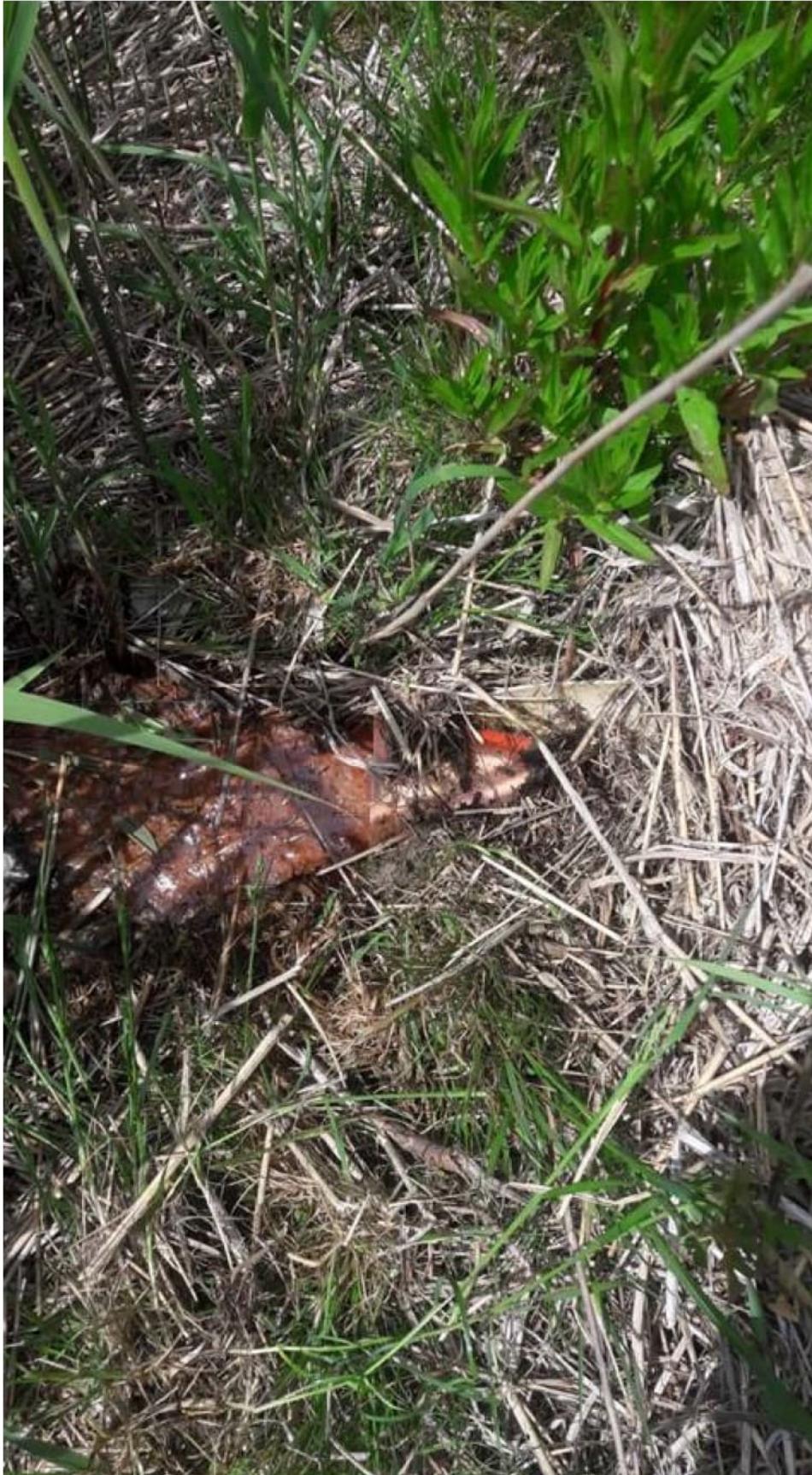
-Bromide/chloride verhouding (O8 is ter hoogte van de drain)