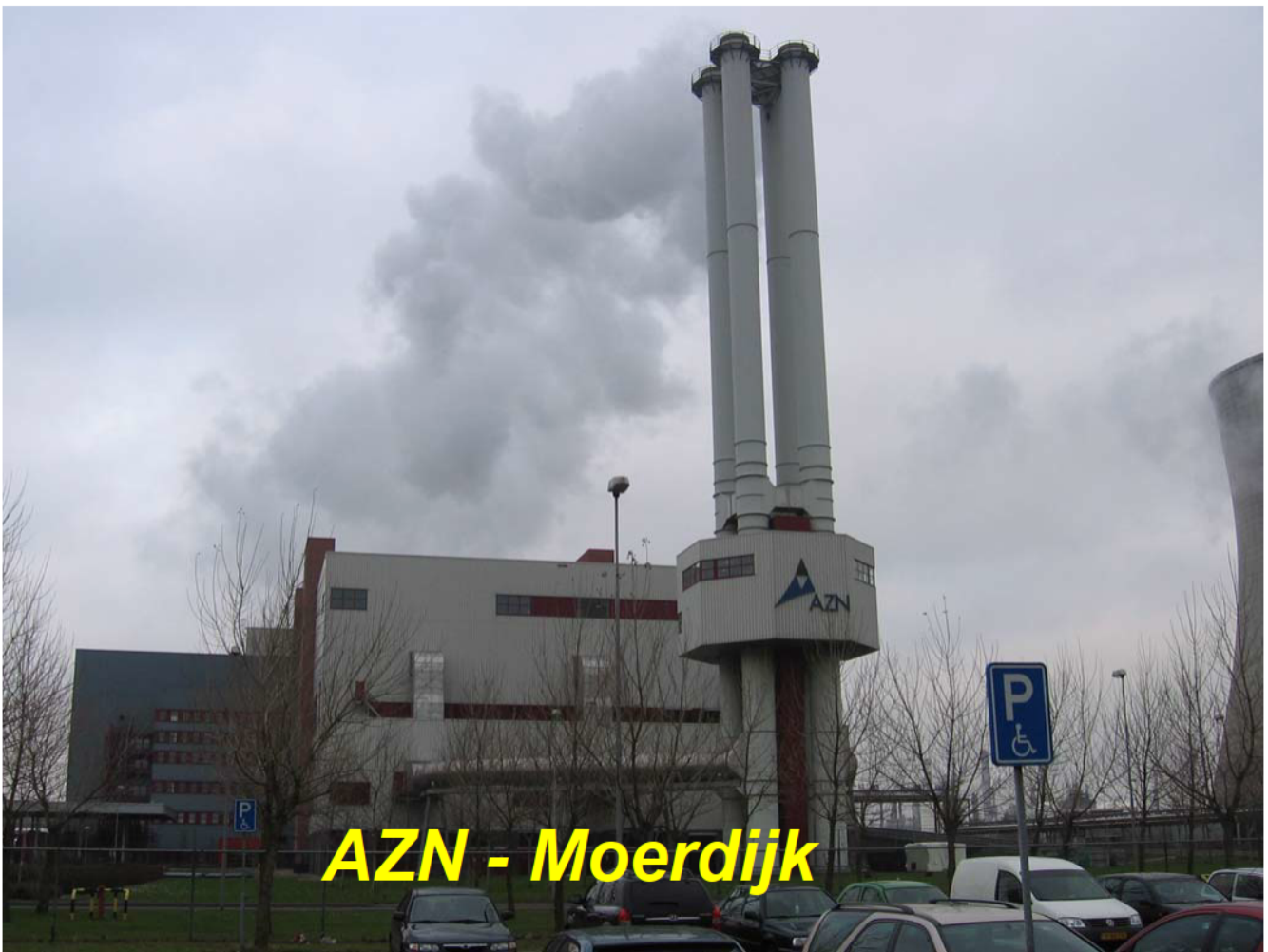
AZN - Moerdijk