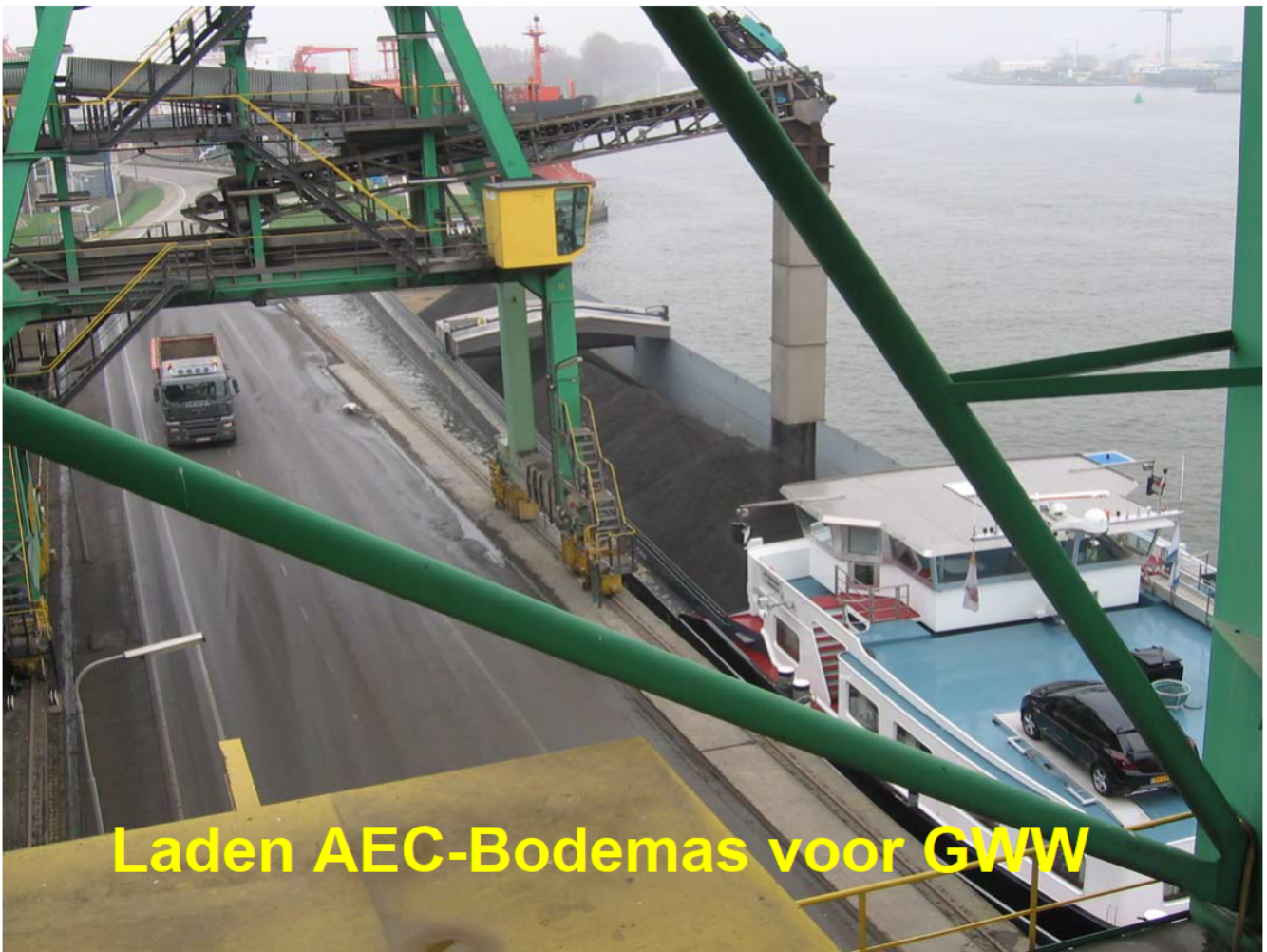
Laden AEC-Bodemas voor GWW