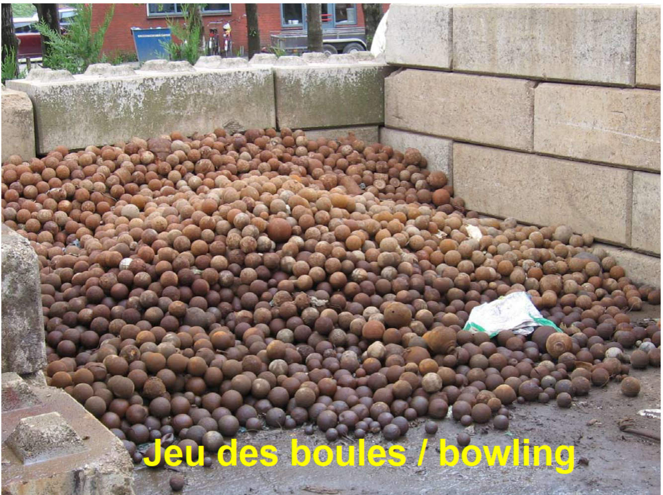
Jeu des boules / bowling