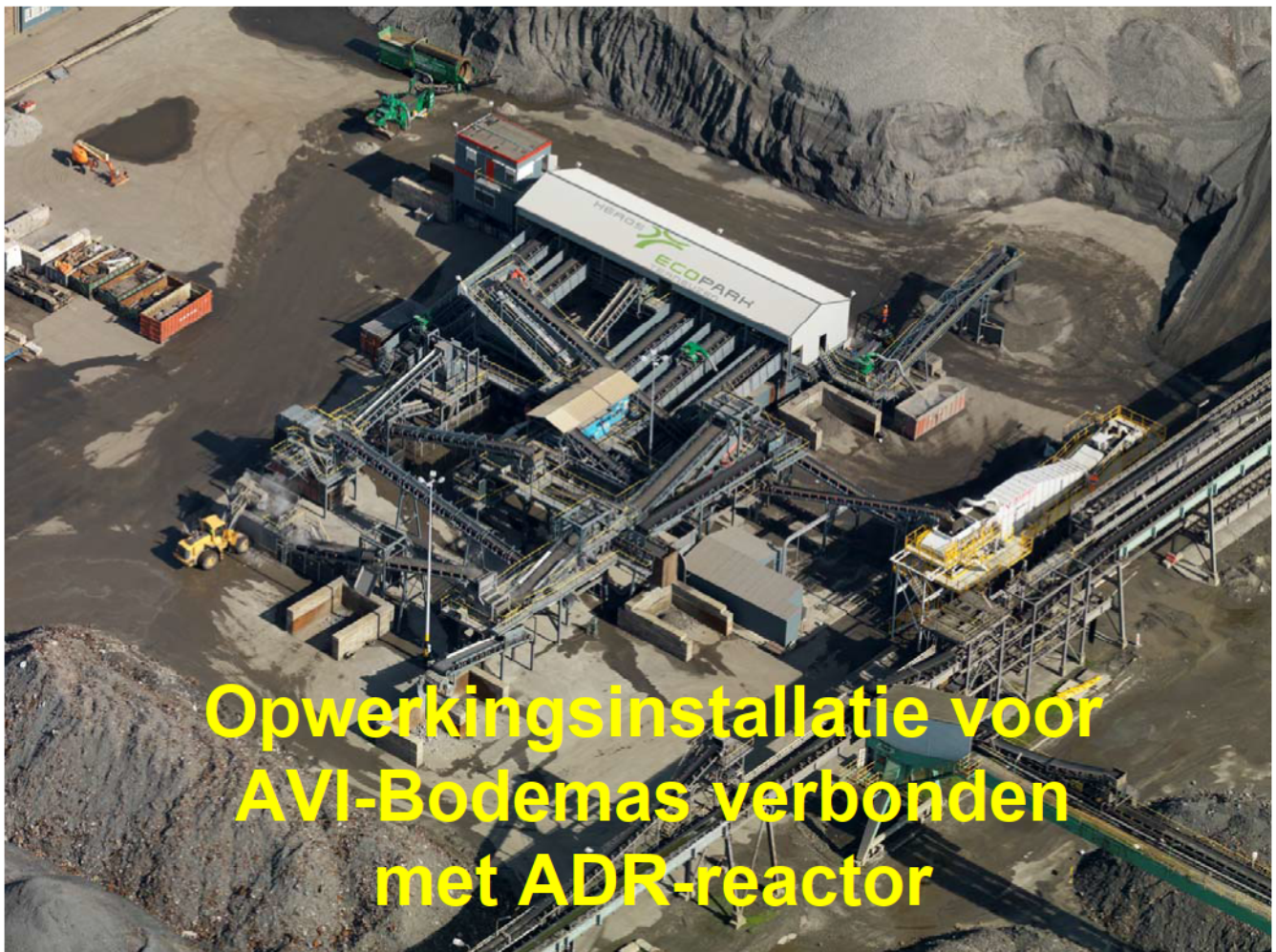
Opwerkingsinstallatie voor AVI-Bodemas verbonden met ADR-reactor