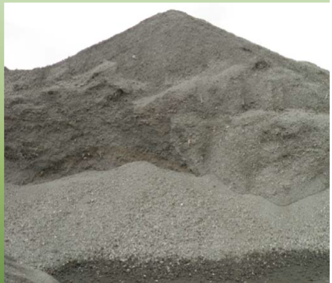
granova. als fundatie