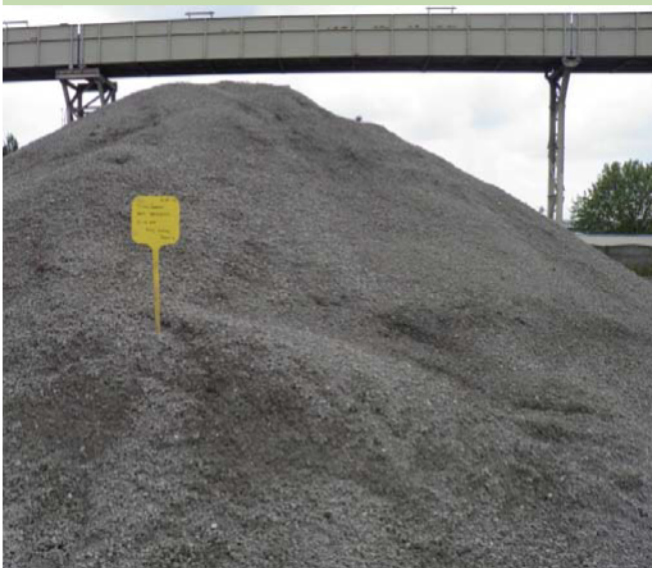
granova. in beton