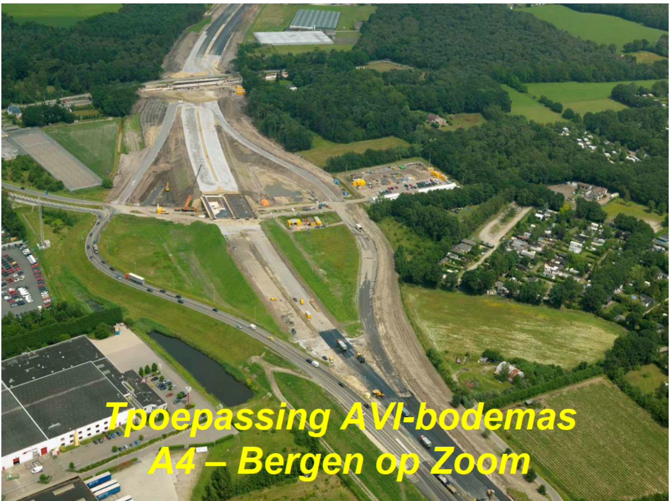
Toepassing AVI-bodemass A4 - Bergen op Zoom