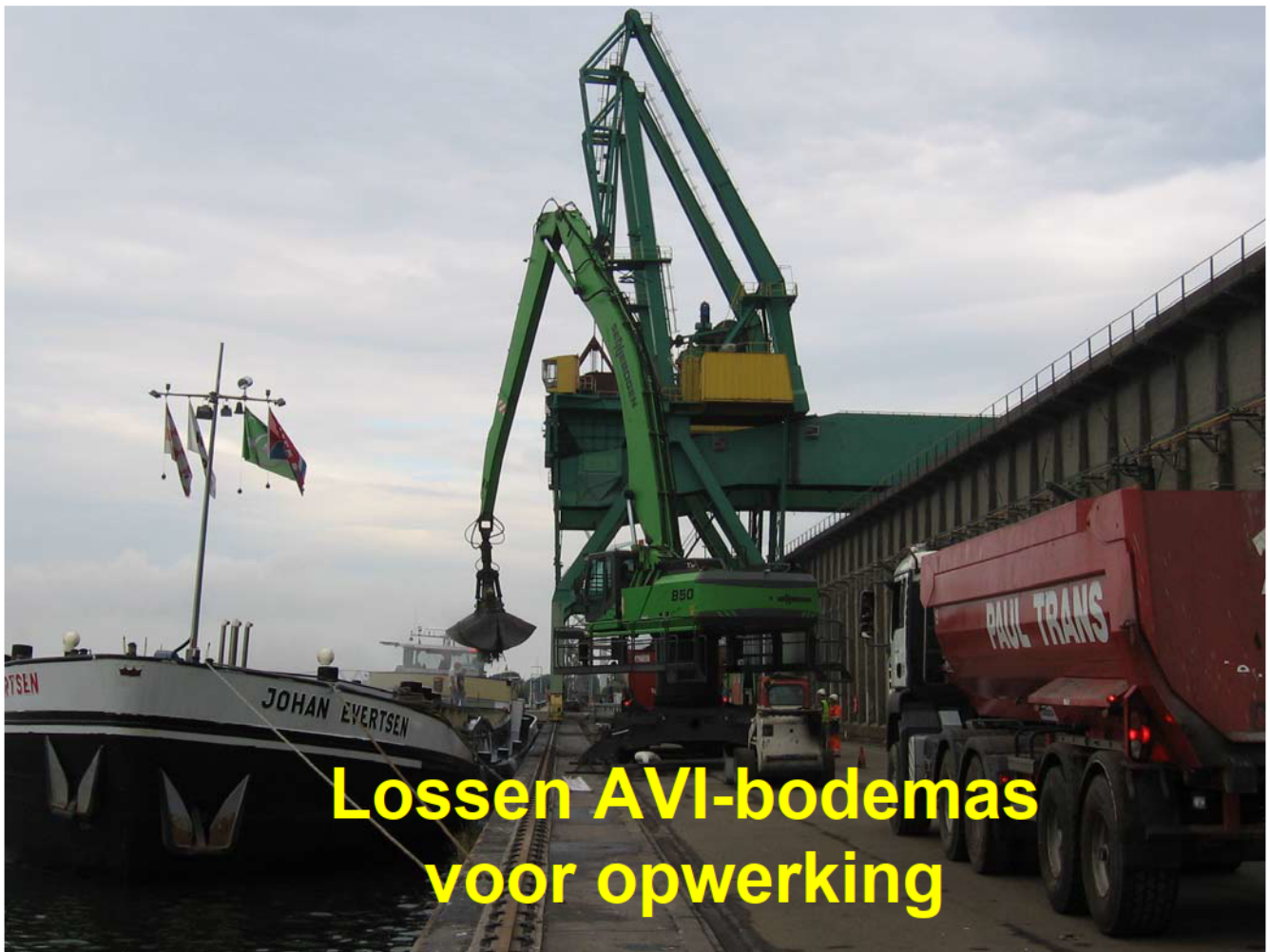
Lossen AVI-bodemas voor opwerking