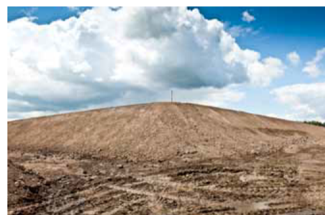
Met paaltjes wordt aangegeven op welke locaties nog zand gestort moet worden, zodat de terp de juiste hoogte krijgt.