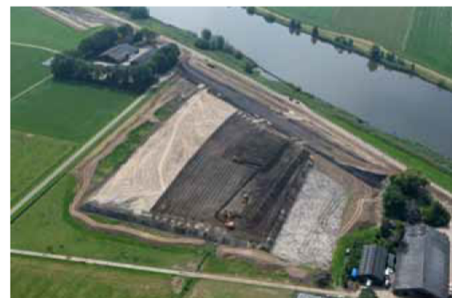
De terpen worden ongeveer zes meter hoog. Terp één tot en met vijf zijn al duidelijk zichtbaar in het landschap.