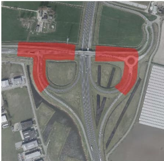
Figuur 4.4 Luchtfoto 2017 (bron: Globespotter), locatie 9.2: A4, aansluiting op de Randweg Oost / N286 in Halsteren. In rood de mogelijke toepassing van TGG.

De omgeving is niet gevoelig, omdat er theoretisch geen veedrenking is en voornamelijk bos.