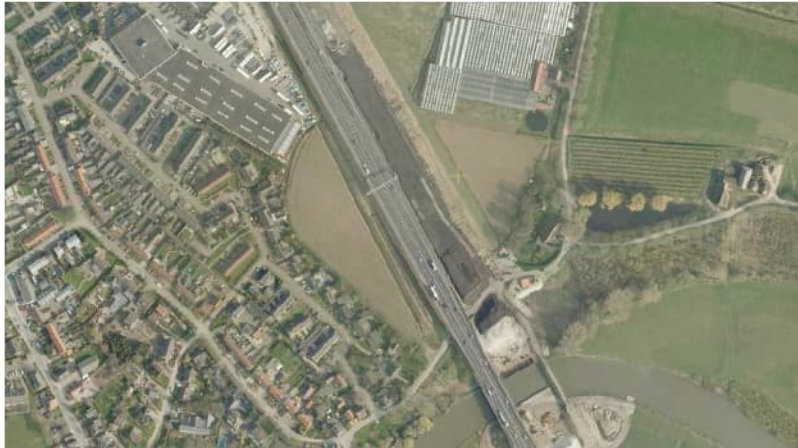
Figuur 4.2 Luchtfoto 2008, A2 aanleg brug over de Linge