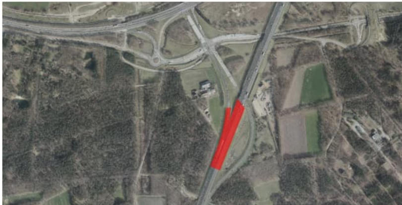
Figuur 4.7 Luchtfoto 2017 (bron: Globespotter), Knooppunt Paalgraven. In rood de toepassing van TGG.

Gezien de ligging van de onderzijde van de bouwstof op circa 15,0 m +NAP en de GHG van 14,1 m +NAP, is volgens het monitoringsrapport voldaan aan de droogleggingseis.