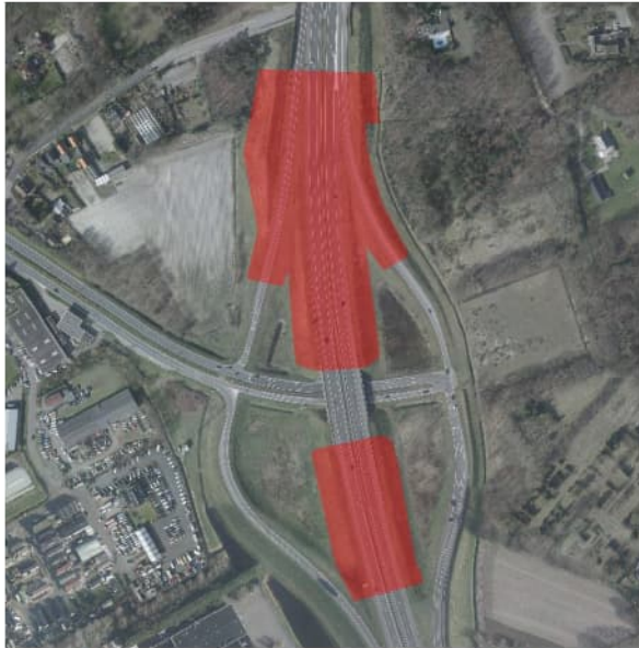
Figuur 4.3 Luchtfoto 2017, locatie 9.1: A4, aansluiting op de Randweg Oost / N286 in Bergen op Zoom. In rood de toepassing van TGG.