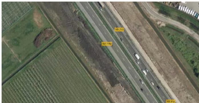
Figuur 4.1 Luchtfoto 2009, verbreding A2, km 107.7

Op basis van de luchtfoto's wordt aangenomen dat er geen isolatiemaatregelen zijn getroffen, anders dan het aanbrengen van asfaltering. Tevens wordt aangenomen dat de TGG direct op het maaiveld is opgebracht.