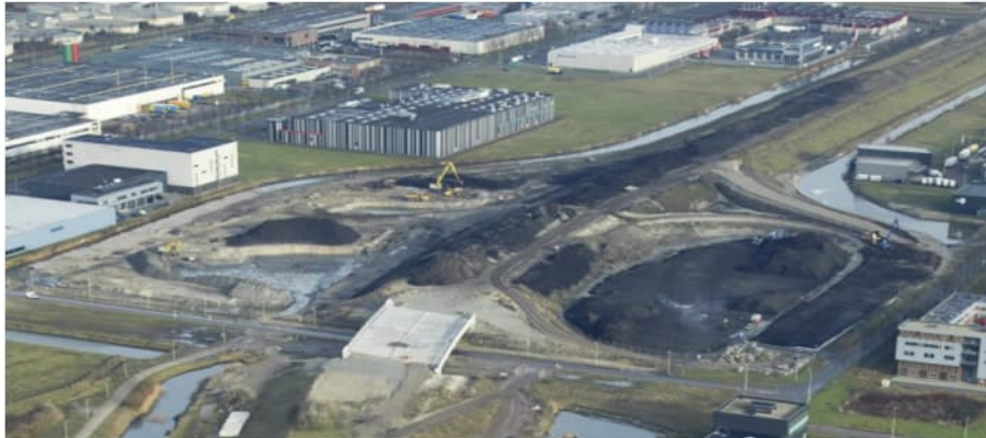
Figuur 4.6 Werkzaamheden aanleg Westrandweg km 13.5, 10 januari 2011

Op basis van de toepassing van TGG direct op het oorspronkelijke maaiveld is het mogelijk dat TGG raakt met het grondwater. Er wordt aangenomen dat er geen absolute drooglegging is. De oorspronkelijke bodem bestaat grotendeels uit veen waardoor er voldoende afdichting is aan de onderzijde. Aan de bovenzijde is er deels afdichting door asfalt, maar aangenomen wordt dat de afdichting bij het talud onvoldoende is om infiltratie tegen te houden.