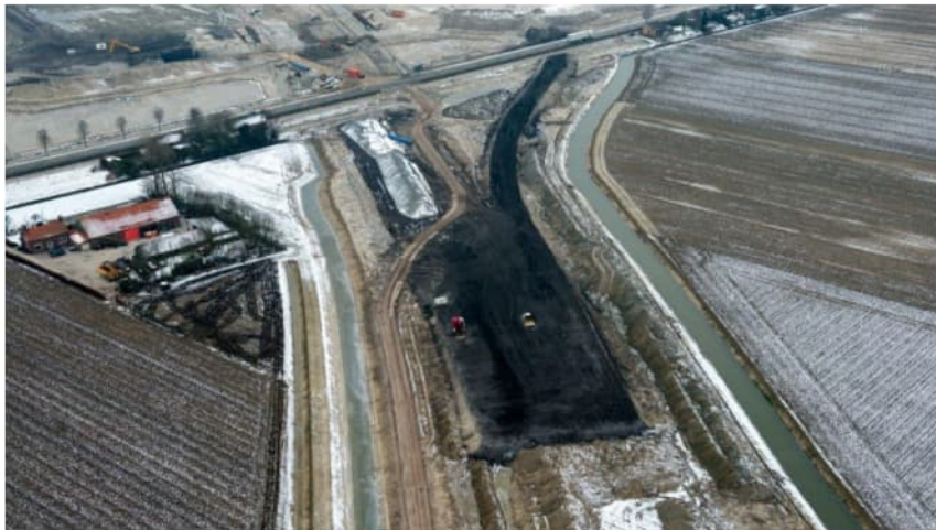
Figuur 4.5 Foto locatie 10: Aanleg A4 12 februari 2013

Tevens is aangenomen er geen isolatiemaatregelen zijn getroffen, anders dan het aanbrengen van asfaltering.