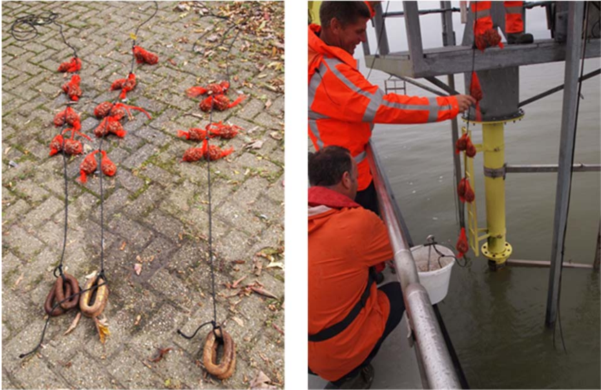
Figuur 2 Voorbeelden van het uithangen van de mosselen. Bevestiging van de mosselen aan het koord (links) met schakels als gewichten, uithangen van een koord aan een meetpaal met een cementanker om het koord strak te houden (rechts).

insnoering gemaakt, zodat een saucijsvormig pakketje mosselen is verkregen. De netjes zijn vastgemaakt aan een koord met een onderlinge afstand van 20–30 cm (3 tot 4 -netjes per koord). Onderaan het koord werd een gewicht gehangen opdat de mosselen verticaal zouden blijven hangen. Drie koorden zijn vervolgens opgehangen aan een meetpaal, meerpaal of ponton, afhankelijk van de situatie bij de te onderzoeken locatie (Figuur 2). De afstand van de waterbodem bedroeg afhankelijk van de locatie 0,5 tot 2 m. Bij locatie Maassluis echter worden de netjes zo hoog mogelijk in de waterkolom gehangen (rekening houdend met het getij), om de kans op blootstelling aan té zout water te minimaliseren.